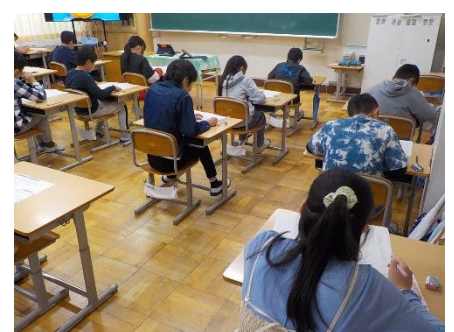
6年生 全国学力・学習状況調査