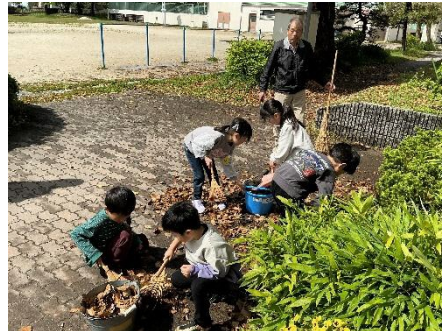
1年生 そうじ用具の使い方