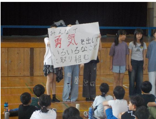
委員会からの発表

また各色団長、副団長からは、これからリーダーとして団員を引っ張っていこうという強い決意が発表されました。頼もしい姿に感動しました。