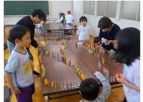
ゆめのかいとっしょ