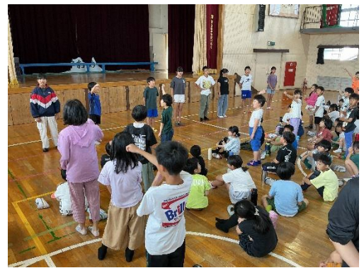
各色団長・副団長の紹介