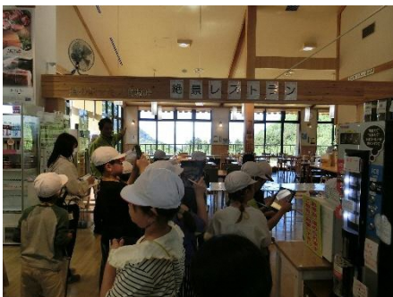
3年生 高島市内めぐり