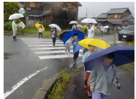
1・2年生 交通安全教室

また、本校では、子どもたちが安全に登下校できるよう、保護者、地域、学校で協力して安全確保に努めています。学校では、教職員によるパトロールや交通安全指導、また学級での指導などを行っているところですが、子どもたちの下校の様子にはまだまだ危険なところがあり、保護者の皆さんをはじめ多くの地域の方々に見守っていただいていることに感謝しています。一方で、子どもたちが、自分で自分の身を守るという意識と実践力をつけていけるよう、学校でも指導をします。それぞれのお立場でも指導や支援をいただきますようお願いいたします。