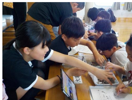
5年生 フローティングスクール