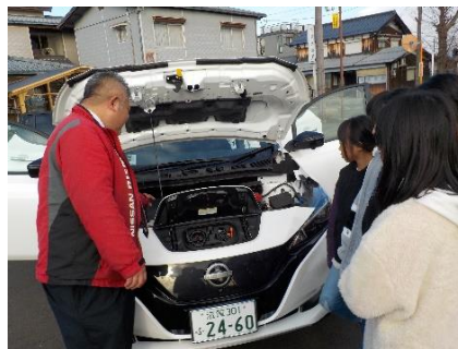
5年生 自動車工業出前授業