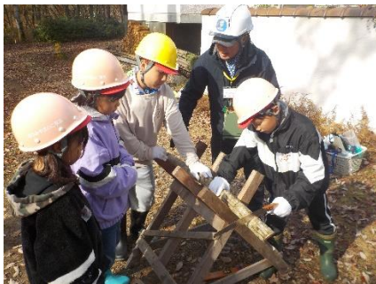
4年生 やまのこ学習