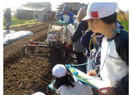
3年生 キャベツ畑の見学