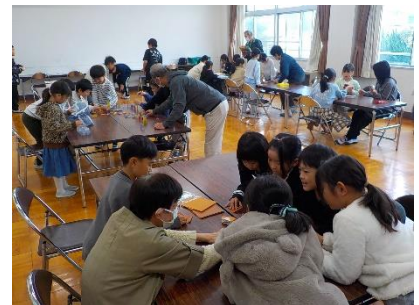
ゆめのかいといっしょ

最後になりますが、今学期も本校の教育活動に様々な形でご支援ご協力いただき、本当にありがとうございました。