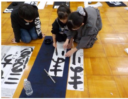
1年生 6年生との「かきぞめ」