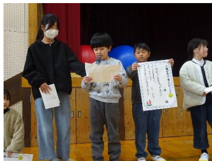
学級での取組発表