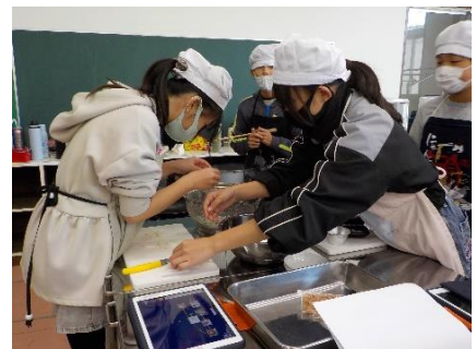
6年生 こんだてを工夫して調理実習