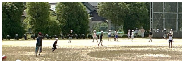
全校みんなで鬼ごっこ