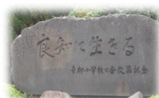
石碑「良知に生きる」