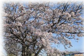
校庭で咲き誇る桜

★学校運営について、ご意見をいただき、教職員と熟議を行っていただきます。よりよい教育活動ができるように、ご協力よろしくお願いいたします。