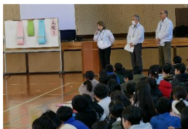
【人権擁護委員さんからの講話】