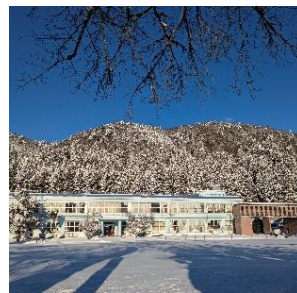
積雪と青い校舎と青空 (23日朝撮影)

特に高学年は卒業に向けた取り組みが始まりますので、本人を含め家族みんなで、うがい・手洗い・十分な睡眠を心がけ、インフルエンザなどに負けない体づくりに努めましょう。