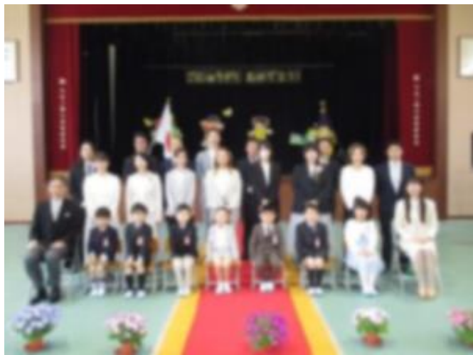
入学式後の記念撮影の様子。

ところで、入学式の式辞の中でこんなことがありました。学校長「～7名の1年生のみなさん、入学おめでとう。」1年生「……………」、例年ですと「ありがとう。」と元気な声で返ってくるのですが、返ってこないのびっくりしました。緊張もありタイミングを逸したのかと思い直し、もう一度「7名の1年生のみなさん、入学おめでとう。」と言ってみました。すると、「ありがとう。」と今度は返ってきました。正直ホッとしました。そんな1年生ですが、今では姿勢よく座って担任の先生の話をしっかり聞くことができている。登校中のあいさつも元気よくできています。