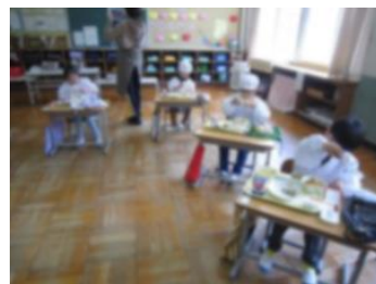
給食初日の様子。カレーライスはおしかったようです。