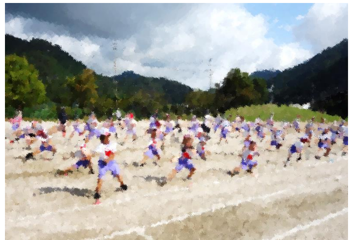
全校児童77人の踊りと元気のよいかけ声に法被