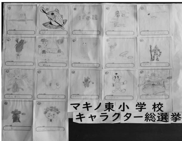
17の作品の中からどれが選ばれるか…