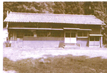
天増川分校 大正時代から昭和20年代まで、天増川の子どもは分校で4年間学習したあと、県境を越え、熊川小学校に通学していた。