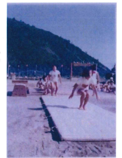
運動会でマット運動 旧校舎の時代。校舎から歩道橋で道を渡った下の運動場で開催。(昭和35年～昭和57年)