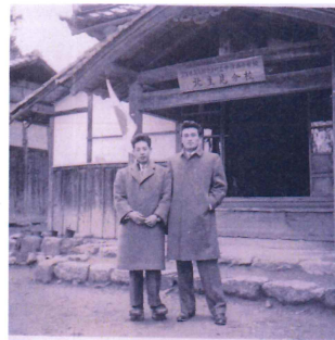
北生見分校 北生見・南生見・追分の子どもたちが通学。昭和36年に閉校となる。