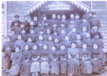
明治44年 三谷尋常高等小学校卒業記念写真