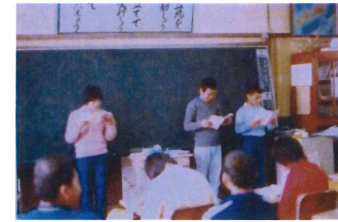
旧校舎での授業風景