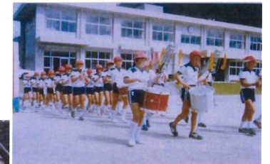
校舎新築になって初めての運動会 この時期でも鼓笛隊が編制できた！