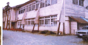
現在の今津西公民館の位置にあった旧校舎。昭和56年まで使用された。