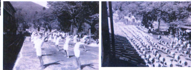
昭和17年頃の運動会 運動場はなく、校舎の前の細長いスペースで行う。子どもの数の多さに驚く