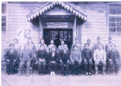
昭和21年の卒業記念写真 校名は英語でMitani Primary Schoolと書かれてある