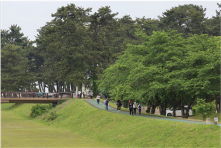
▶知内浜オートキャンプ場