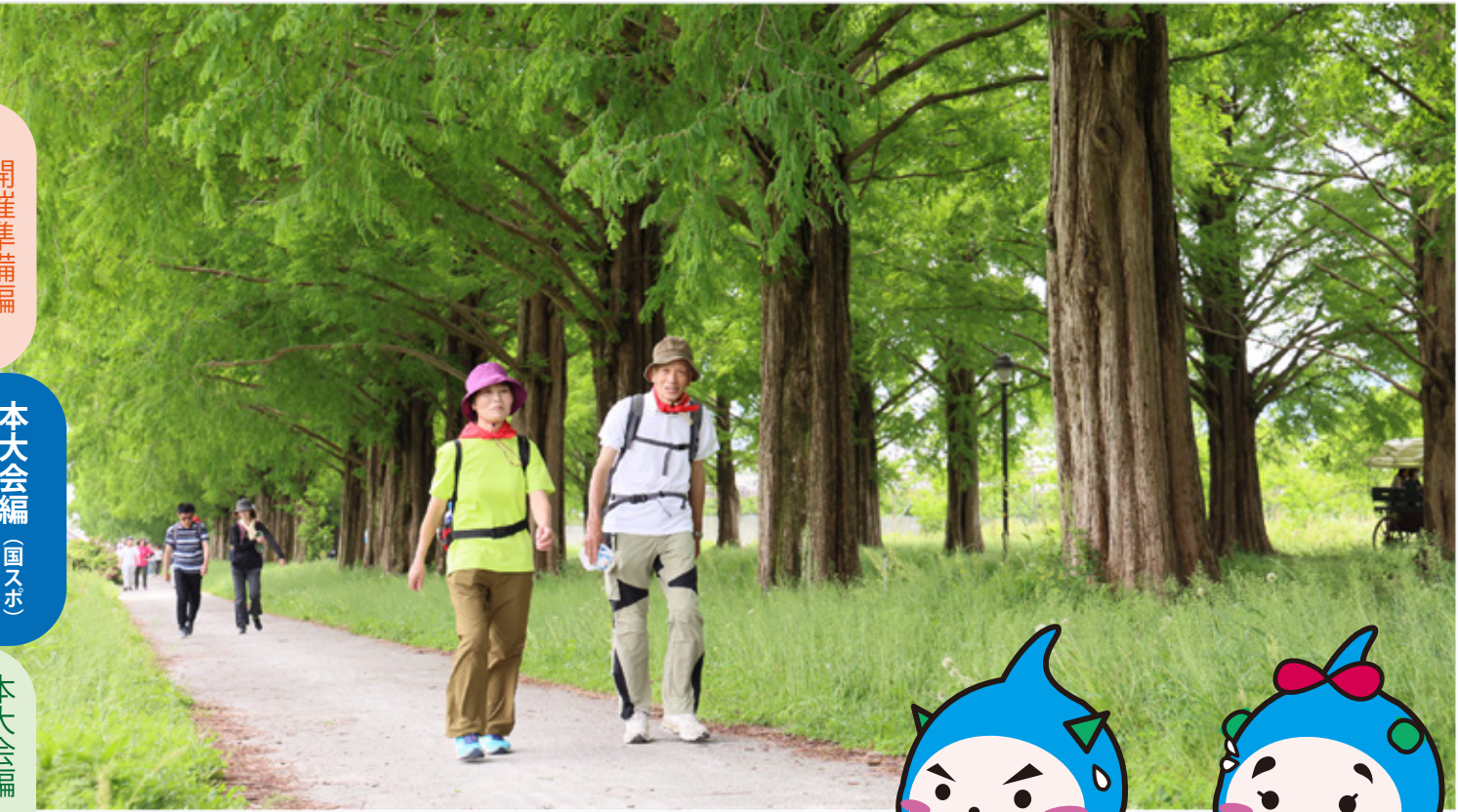
▶高島の自然を存分に楽しむ特設コース（メタセコイア並木）