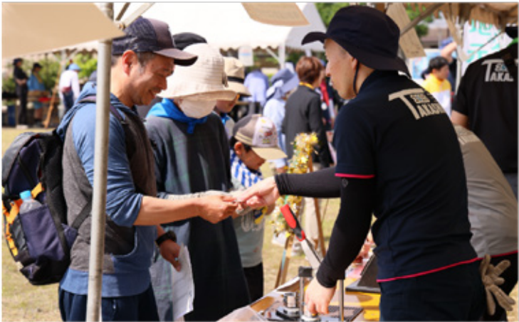
▶国スポ啓発ブース