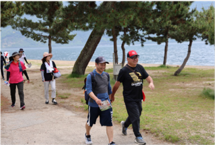
▶湖岸沿いの松並木を抜けて