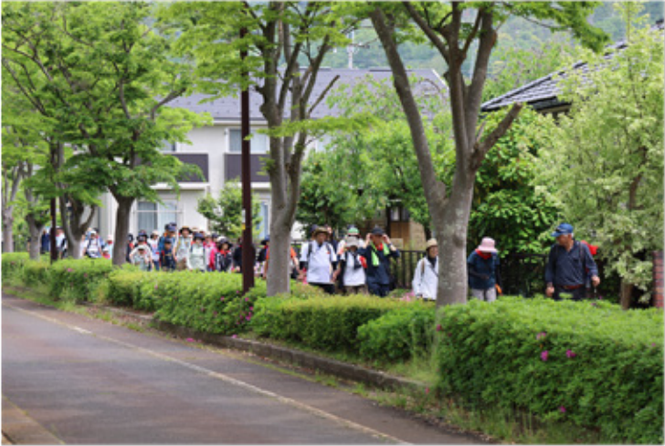
▶JRマキノ駅前から琵琶湖を目指します。