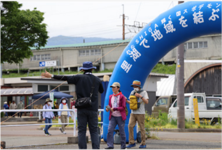
▶ゴールしました、お疲れ様！