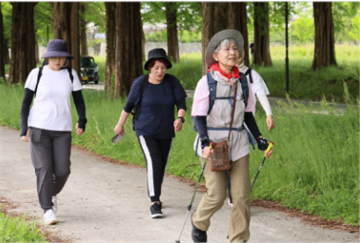
▶メタセコイア並木