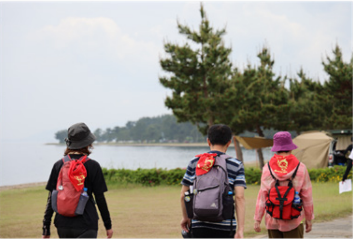
▶高木浜オートキャンプ場