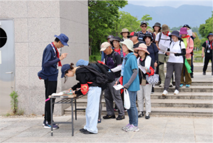
▶チェックポイントではスタンプを押します。