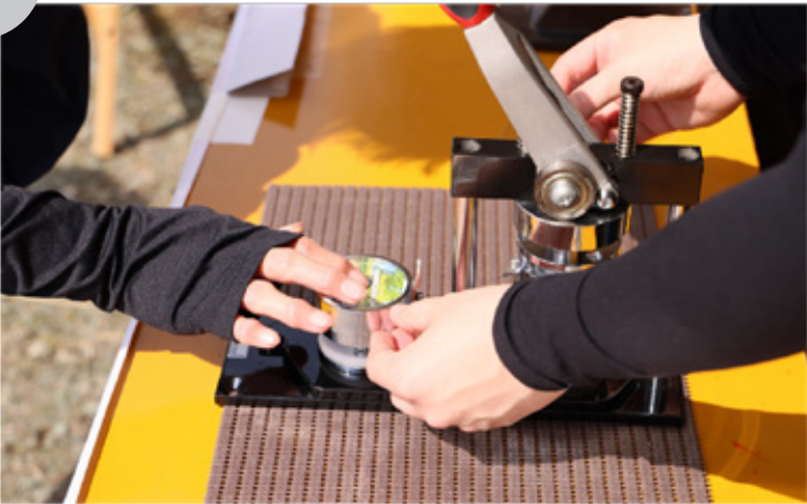
▶国スポ啓発ブース（缶バッジ作り）

5月18日（日）に、マキノ地域特設ウォーキングコースにおいて開催し、滋賀県各地から集まった181名が、自分の体力やスタイルに合わせて選んだロングコース（約10.6km）とショートコース（約3.8km）に分かれてウォーキングを楽しみました。