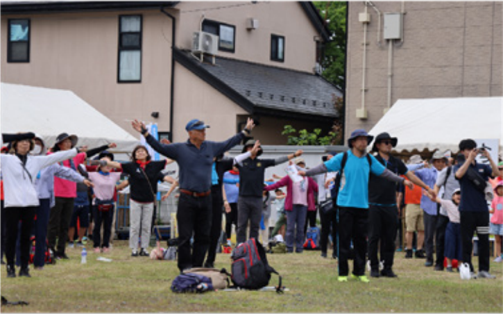
▶ウォーミングアップを入念に