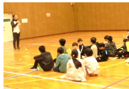
【水谷高島スポ少団代表のあいさつ】

これから安全に十分留意しながらそれぞれの活動に励んでほしいと思います。高島スポーツ少年団では、入団申込を随時受け付けています。事務局が高島公民館にありますので、ふるって申し込みくださるようお願いいたします。