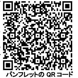
パンフレットのQRコード