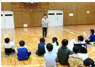
団員ちかいのことば