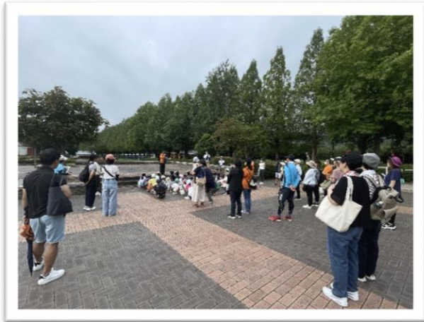
ピックランドからスタート

8月19日 マキ/西小学校のPTA親子ふれあい事業でマキ/フォトリゲイニングが行われました。西小学区の名所や旧跡、昔話に出てくるようなポイントを親子のチームで巡り、訪ねた場所の点数で順位を競いました。優勝チームは校長先生から表彰を受けました。