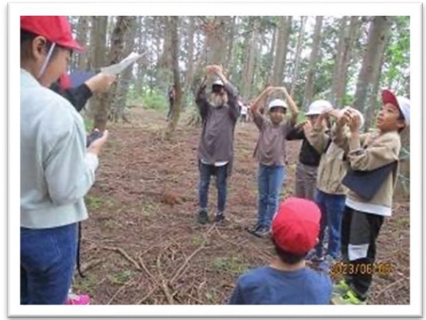
上級生がゲームを考えてくれました