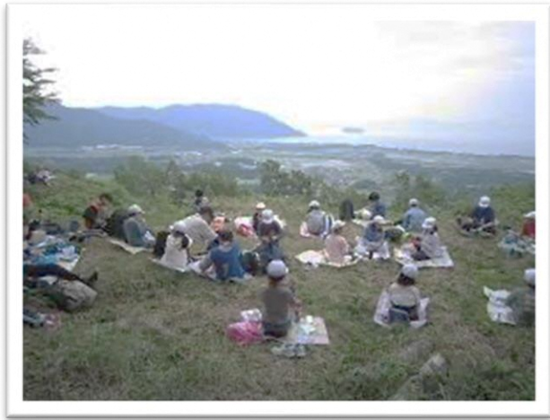
琵琶湖の景色を見ながらお弁当