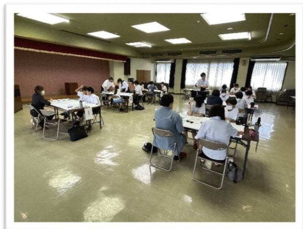
7つのグループで熟議

8月30日マキ/中学校の学校運営協議会では学校運営協議会、PTA、民生委員、教師の皆さんに中学生を交えて、「だれもが居心地のよいマキ/中にするためには」をテーマに熟議を行いました。