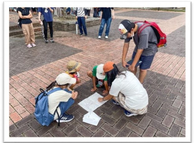
どこを周るか作戦会議