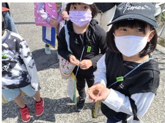
シロヒトリの毛虫も手に乗せられます。

5月2日 マキ/南小学校の2年生の生活科「春の町をさんぽしよう」が行われました。通学路を地域の方に草花の名前などを教えてもらいながら歩きました。