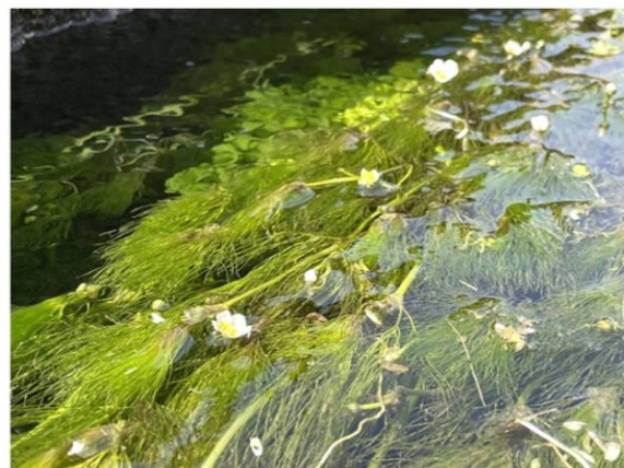
用水路のバイカモ