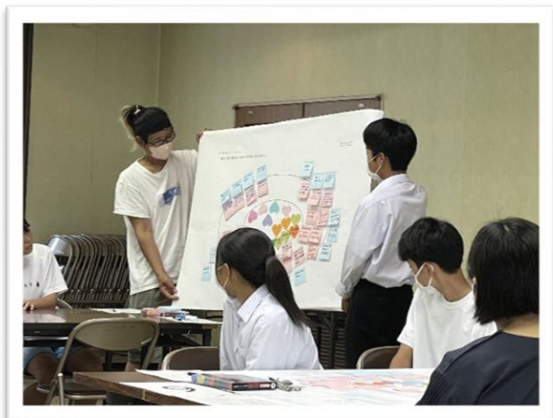
グループからの発表