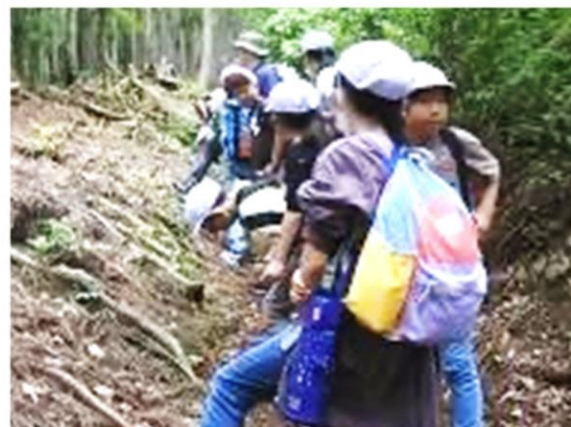
登りの道の途中で休憩

6月6日 マキ/南小学校全校たてわり遠足が行われました。地元の自然と歴史の素晴らしさを体感してもらうため、田屋城後に登りました。城跡からはマキノの里から琵琶湖に広がる素晴らしい風景を見ることが出来ました。