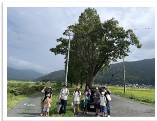
昔話に出てくるよみの木