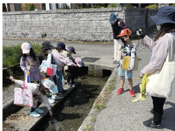
地域の洗い場は湧き水できれい