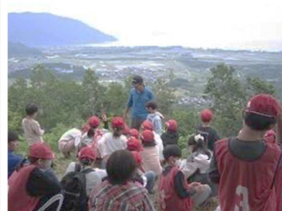
地域の方からの説明を聞きました