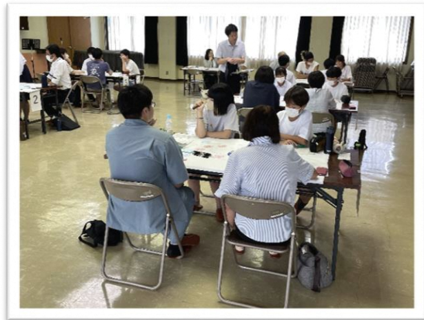
各グループで熱心に話し合い