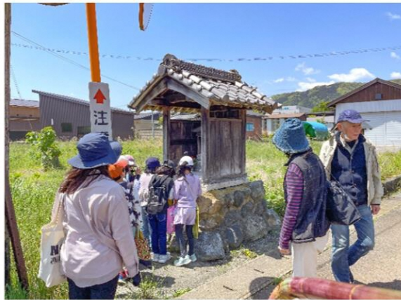
通学路のお地蔵様におまいり