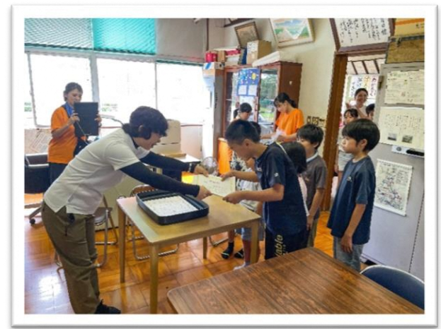
表彰を受ける優勝チーム