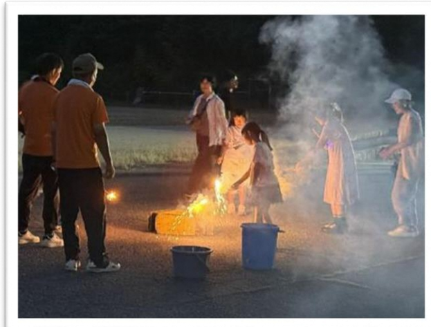
花火も楽しそうです