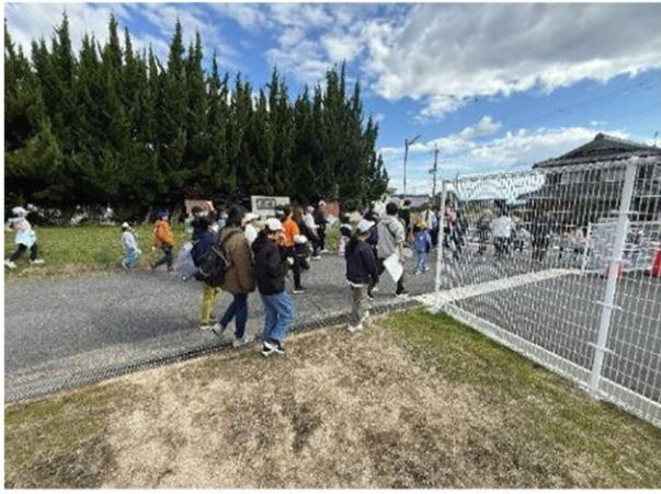
各チームが選んだポイントを目指します

11月6日 マキ/西小学校のPTA主催で地域の方に教えてもらった地域資源を回るマキ/フォトロゲイニングが今年も行われました。今回は学校から南のエリアを散策しました。親子のグループがチェックポイントとなった地域資源をどれだけたくさん回れるかを競いました。