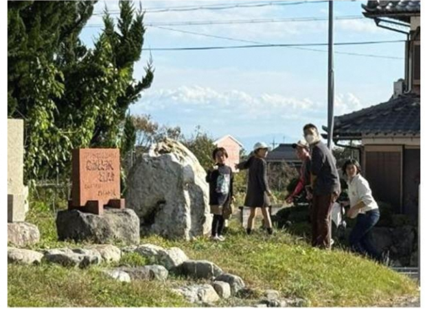
チェックポイントをみんなで確認