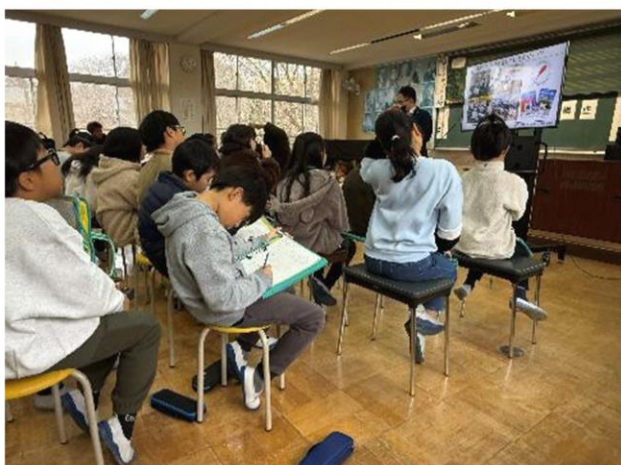
講師の話をしっかりメモに取っています

12月17日マキ/南小学校では3年生から6年生までを対象に、「ゆめのきっかけ講座」が行われました。来ていただいた6人の社会人の方から、仕事への思いや努力したこと等についてお話をお聞きし、たくさんメモをしていました。