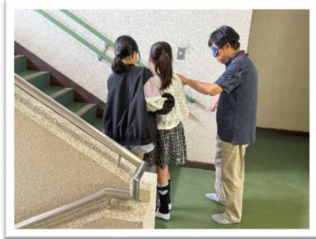
どうすると安心して登れるかな？