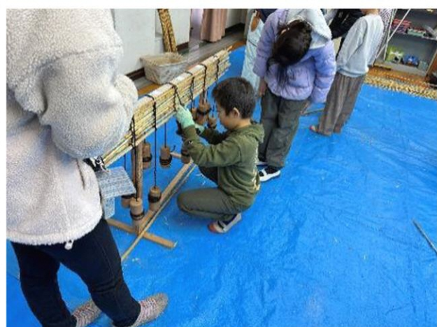
短くなったシュロ縄は延ばしながら編んでいきます

1月24日マキ/西小学校では、PTAの皆さんによるスノーフェスティバルが行われました。今年は雪がたくさん降り、8年ぶりの開催となりました。