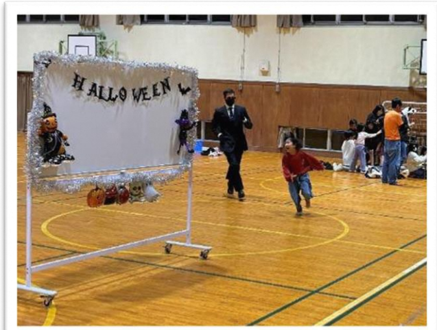
楽しい企画がいくつもありました

10月25日 マキ/西小学校では PTA の皆さんがハロウィンパーティーを行っていただきました。子どもも大人も仮装して楽しいひと時を過ごしました。