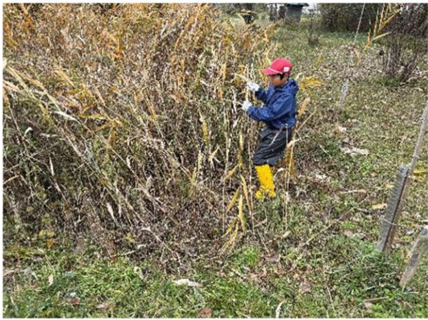
ヨシを鎌で刈っていきます

12月2日マキ/東小学校では4年生が近くの西内沼でヨシの刈取り作業を行い、水質浄化に貢献していることなども学習しました。1月にはこのヨシでよしずを作ります。