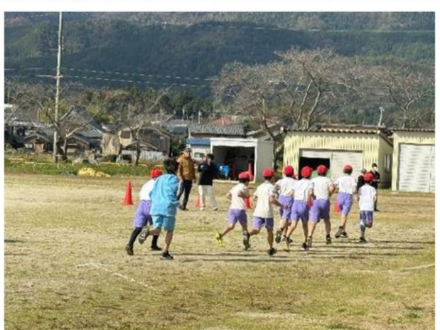
中学生が伴走してくれました