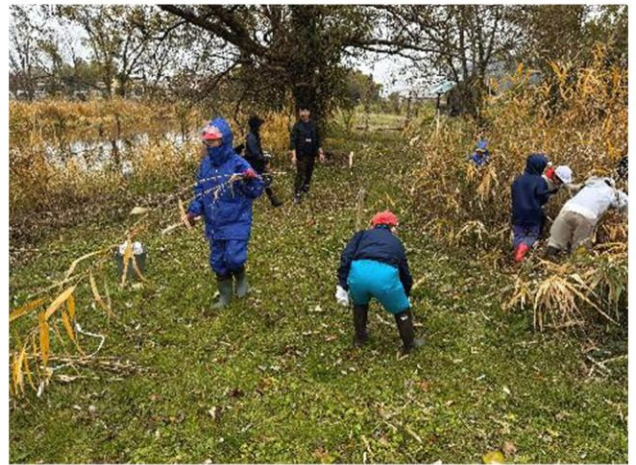
刈り取ったヨシはまとめて乾燥させます

12月17日マキ/南小学校では3年生から6年生までを対象に、「ゆめのきっかけ講座」が行われました。来ていただいた6人の社会人の方から、仕事への思いや努力したこと等についてお話をお聞きし、たくさんメモをしていました。