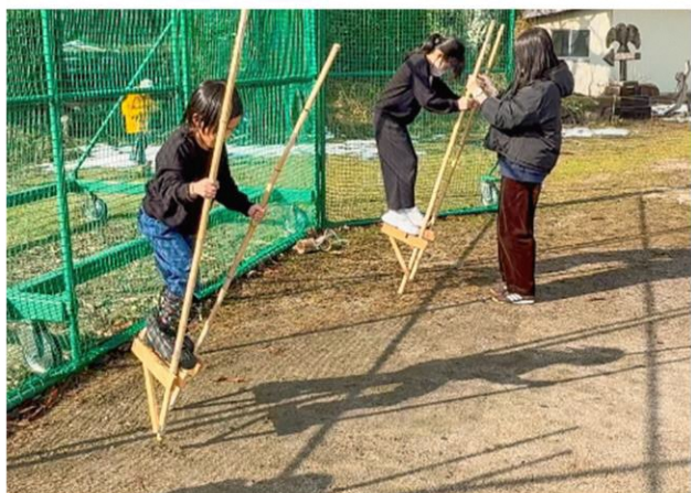
すごく上手になりました

1月16日マキ/西小学校では昔遊びの体験が行われ、子どもたちは、竹トンボや竹ぼっくり、竹馬などに挑戦しました。