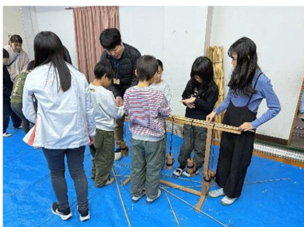
1本ずつ重ねて編んでいきます

1月20日マキ/東小学校では12月に刈り取ったヨシを使って、よしづづくりが行われました。ヨシを1本ずつシュロ縄で編んでいきよしづを作りました。