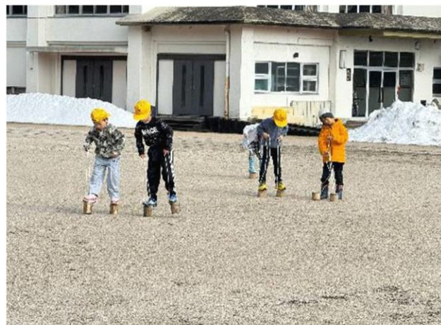
竹ぼっくりは簡単に乗れます

1月20日マキ/東小学校では12月に刈り取ったヨシを使って、よしづづくりが行われました。ヨシを1本ずつシュロ縄で編んでいきよしづを作りました。