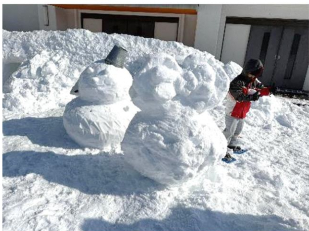
雪だるまもできました