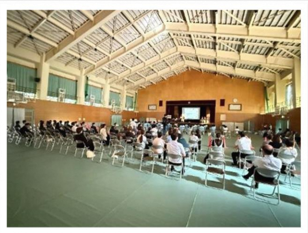
たくさんの方の前でも堂々とした演技でした