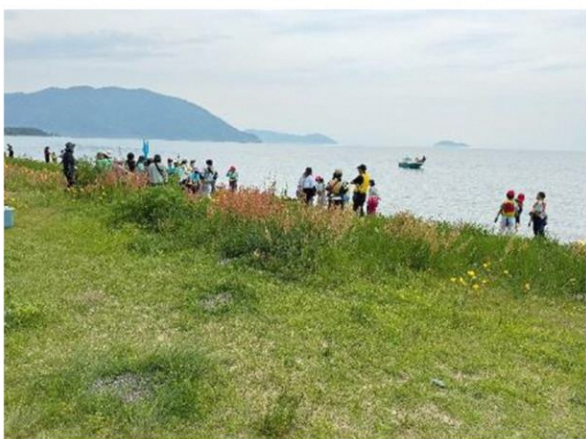
休憩ポイントでは清掃活動も行いました

5月15日、16日 マキ/東小学校の自然教室が行われました。天候にも恵まれ、たくさんのサポーターの協力も得て、5・6年生が協力し合って、2日間の長旅を達成しました。