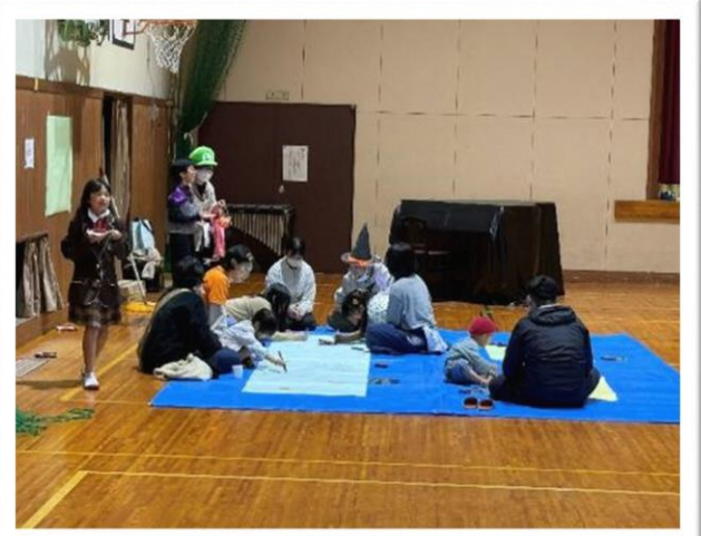
小さな子も一緒に楽しむことができました