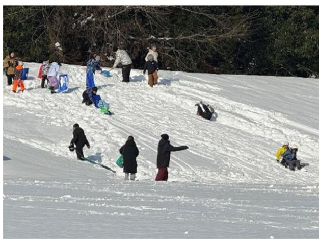
校庭のスロープで楽しく滑ります

1月24日マキ/西小学校では、PTAの皆さんによるスノーフェスティバルが行われました。今年は雪がたくさん降り、8年ぶりの開催となりました。