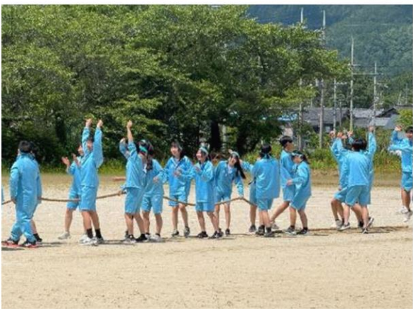
綱引きはとても盛り上がりました

5月28日 マキ/中学校で運動会が行われ、たくさんの保護者、地域の方も応援に来られました。