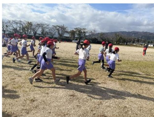
一斉にスタートです

11月11日 マキ/3小学校合同マラソンがマキ/中学校のグラウンドをスタートに行われました。中学校が会場となっているので、中学1年生が伴走や準備、後片付けに協力してくれました。