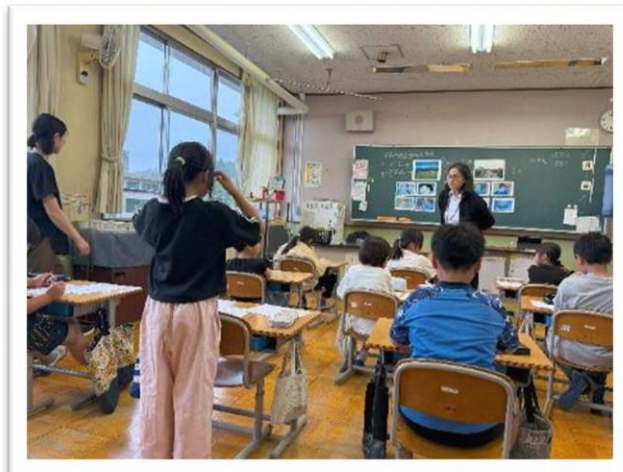
自分の考えを発表しました