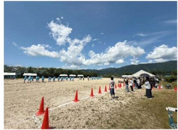
青空の元、気持ちのよい日に実施できました