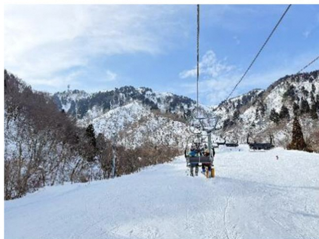
リフトにも乗って長いコースも滑れるようになりました