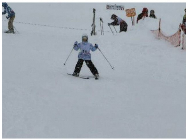
すごく上手になりました

1月から2月にかけてマキ/の小学校ではスキー教室が地元マキ/のスキー場で行われました。滑り始めは不安なところもありましたが、午後からはみんなリフトを使って長いコースも滑れるようになりました。