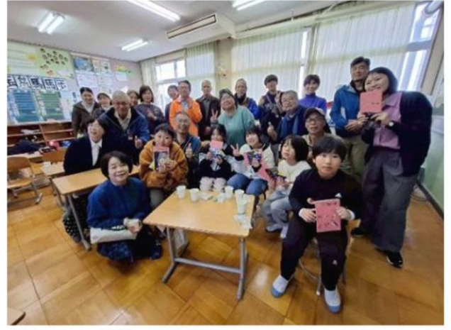
皆さんと記念撮影