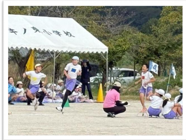
日頃の練習の成果が本番に出せたかな

10月11日 マキ/の3つある小学校で運動会が行われました。各小学校の運動会にはマキ/中学校の生徒が卒業生としてボランティアで運動会の運営を手伝ってくれました。