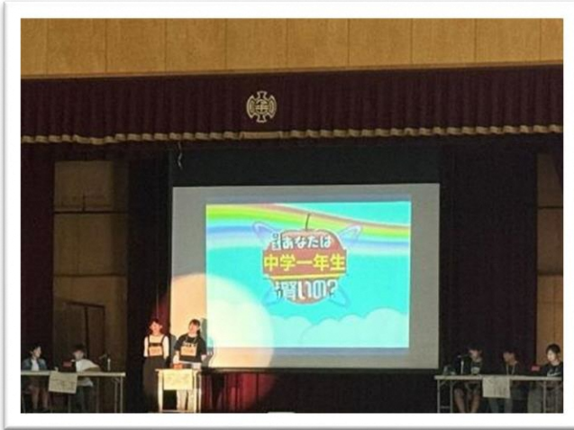
題材も工夫してくれました

9月30日 マキ/中学校で文化祭が行われました。一生懸命練習した成果を地域の皆さんに披露してくれました。