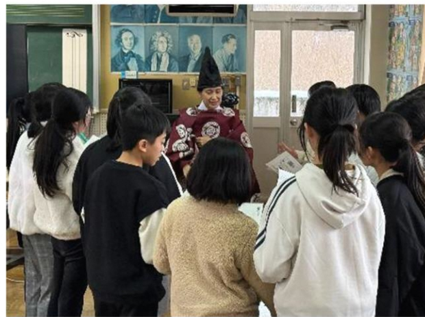
笙について聞きました

1月から2月にかけてマキ/の小学校ではスキー教室が地元マキ/のスキー場で行われました。滑り始めは不安なところもありましたが、午後からはみんなリフトを使って長いコースも滑れるようになりました。