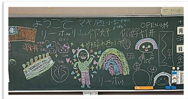
黒板に台湾の皆さんへのメッセージを書িয়েくれました