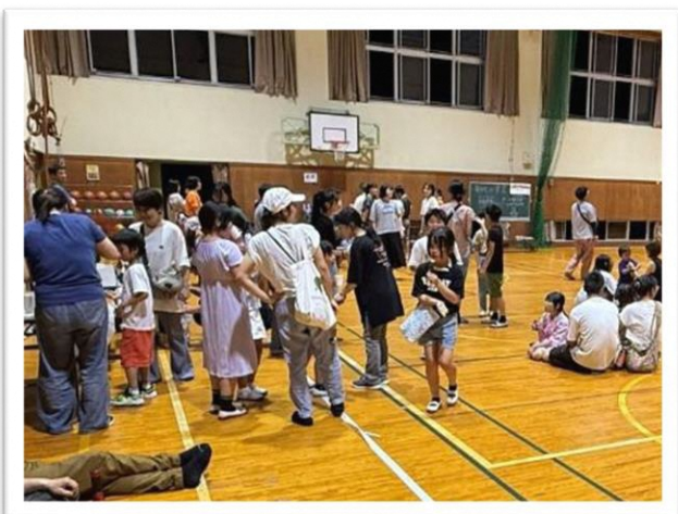
みんな楽しそうに遊んでいます

7月19日 マキ/西小学校 PTA 夏まつりが開催され、夏休み前に子どもたちが集まって、校内を使ってのかくれんぼやカラオケ、外では花火などを楽しみました。