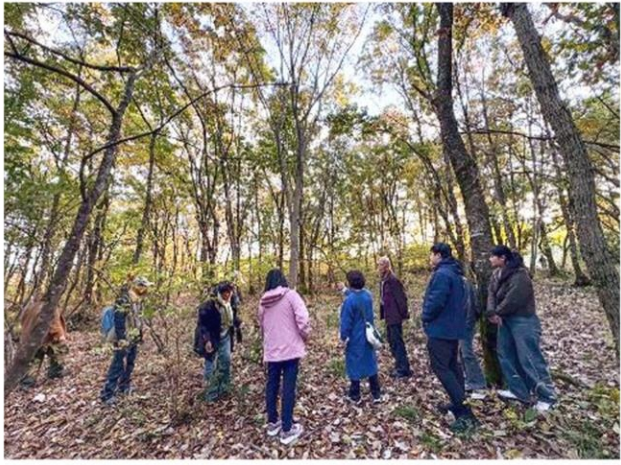
活動しているフィールドも訪問