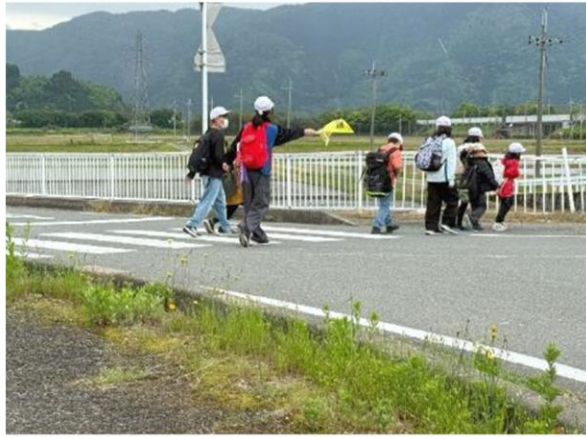
移動途中も上級生がしっかりリードしてくれました

5月9日 マキ/南小学校のたてわり遠足が行われました。今年も小学校から知内浜オートキャンプ場まで歩きました。キャンプ場では、1年生を迎える会が行われ、全校生徒でじゃんけん列車など楽しくゲームができました。