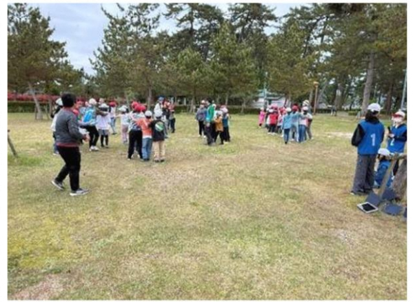
じゃんけん列車で楽しく交流できました

5月15日、16日 マキ/東小学校の自然教室が行われました。天候にも恵まれ、たくさんのサポーターの協力も得て、5・6年生が協力し合って、2日間の長旅を達成しました。