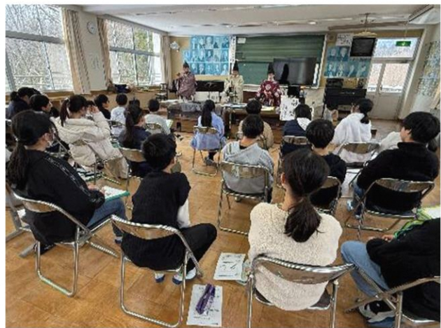
古代からの音色にうっとり

1月27日マキ/南小学校では雅楽鑑賞が行われ、合奏を聞いたり、興味のかいた管楽器の笙(しょう)や箏(ひちりき)、龍笛(りゅうてき)の奏者にお話を聞いたりしました。