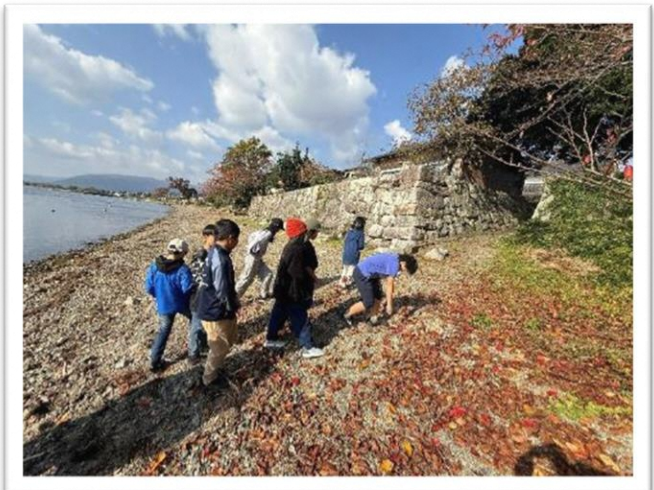
海津の浜の石積みを見学

11月21日 マキ/西小学校では3、4年生が近くの里山で里山学習を行っており、今回台湾で里山活動を行ってられる団体と交流することができました。