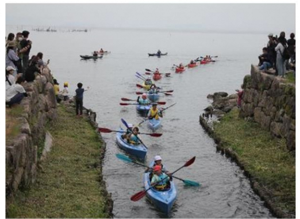
多くの人に迎えられて感動のゴール

5月28日 マキ/中学校で運動会が行われ、たくさんの保護者、地域の方も応援に来られました。