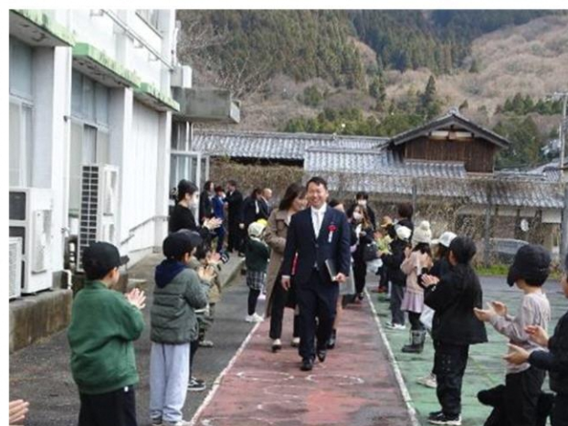
みんなが拍手で送ってくれました