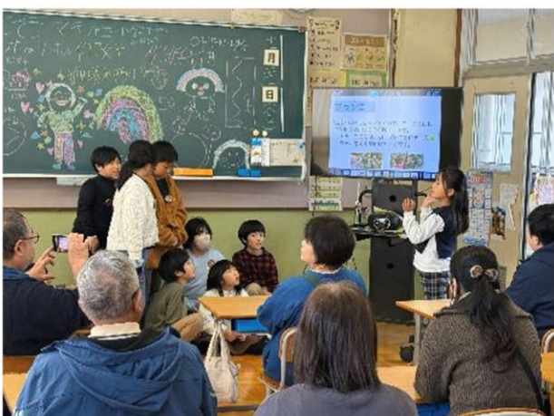
台湾の皆さんに発表してくれました

11月21日 マキ/西小学校では3、4年生が近くの里山で里山学習を行っており、今回台湾で里山活動を行ってられる団体と交流することができました。