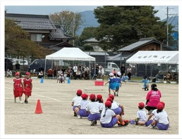
地域の方もたくさん応援に来ていただきました

10月25日 マキ/西小学校では PTA の皆さんがハロウィンパーティーを行っていただきました。子どもも大人も仮装して楽しいひと時を過ごしました。