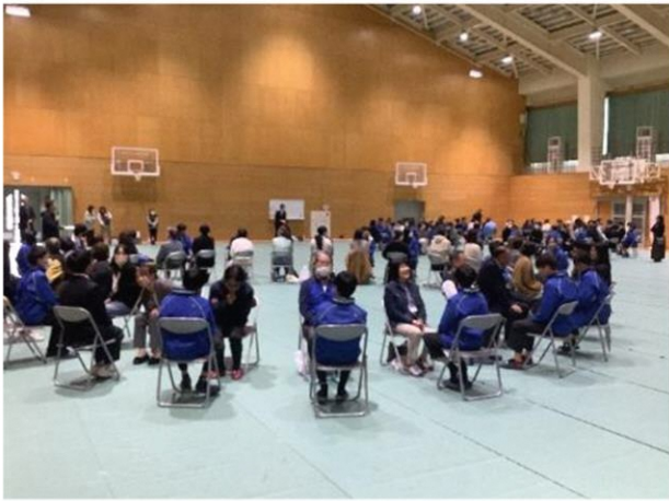
地域の方がたくさん参加してくださいました

11月12日 マキ/中学校で「トークフォークダンス」が開催されました。初めての事業で90人の地域の方に集まっていたか直前まで心配されていましたが、当日は90人を超える方が集まってくれました。スタートすると地域の方も生徒もすごく楽しそうに話され、終了後の感想もどちらかがよかったという感想で、今後の展開が楽しみです。