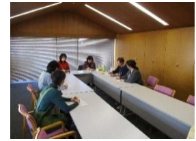
ブックスタートサポーター交流会