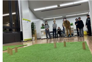
ニュースポーツ（モルック）の普及啓発