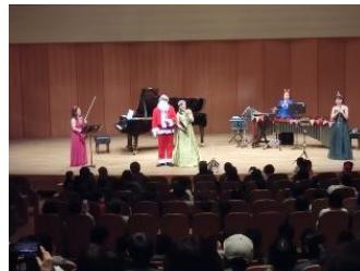
0歳からのコンサート