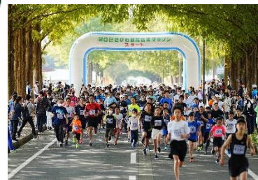
びわ湖高島栗マラソン