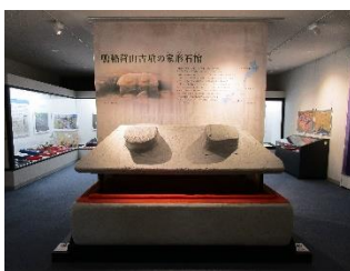
中江藤樹・たかしまミュージアムの館内 (鴨稻荷山古墳の家形石棺の展示)