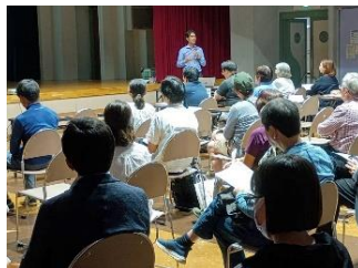
市民大学たかしまアカデミー 公開講座