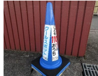
クールスポットの目印となるカラーコーン