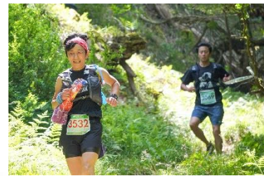
びわ湖高島トレイルランニング