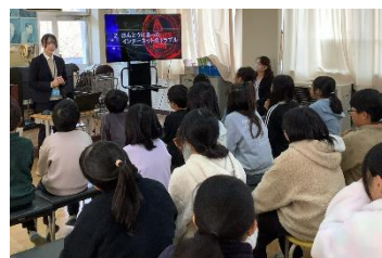
いのちを大切にする講演会