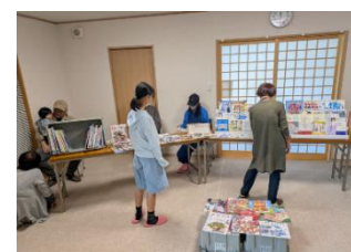
地域イベントでの訪問貸出