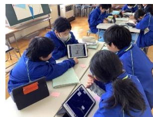
タブレット端末を活用した学び