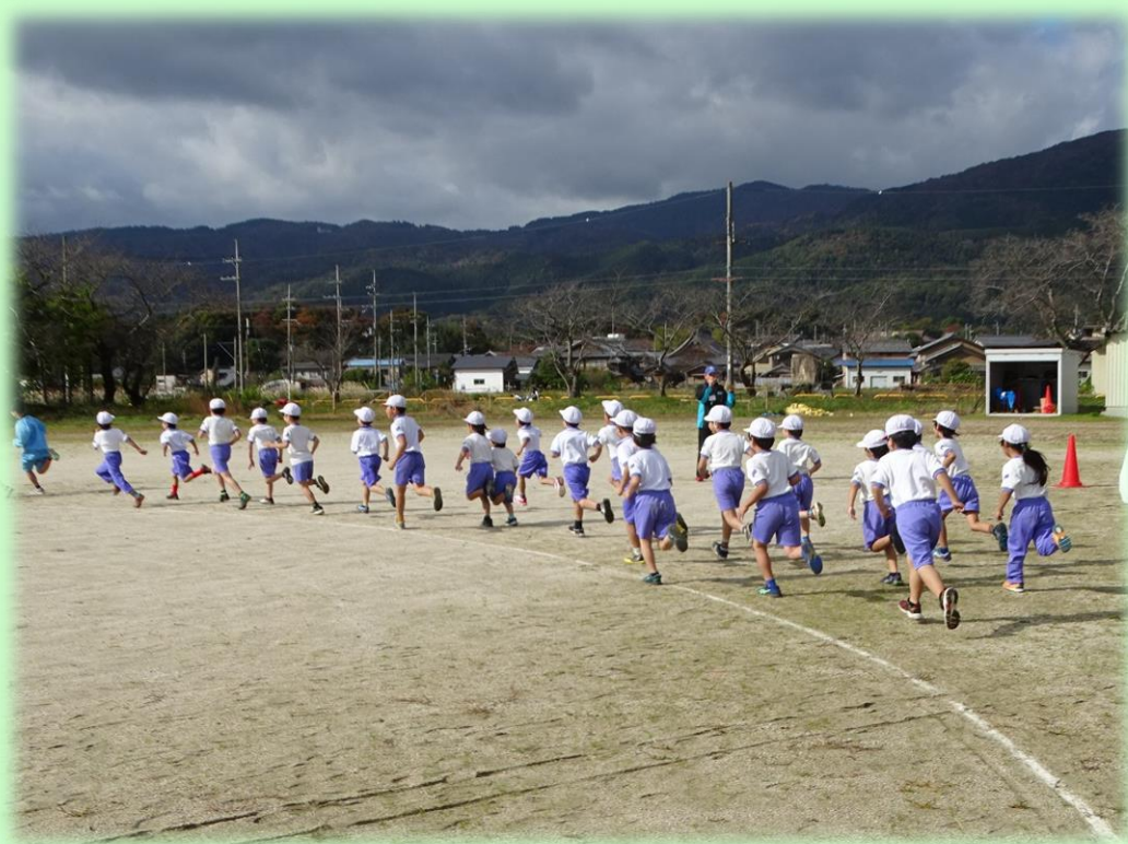
マキノ中学校区での3小学校で合同開催されたマラソン大会