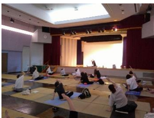
公民館教室 「アロマヨガ教室」