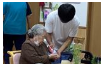
福祉施設での職場体験