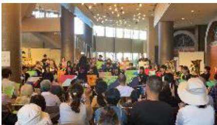
琵琶湖周航の歌うたつたえロビーコンサート