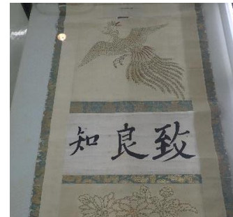
市指定文化財 (中江藤樹筆「致良知」三大字) 保存修理