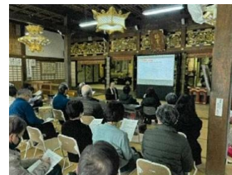
高島市文化財保存活用地域協議会 による文化財見学会