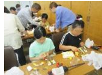
ぶんげい工作教室「かざろう」