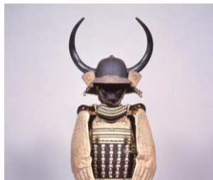
織田信澄白糸威具足