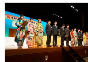
二十歳のつどい 実行委員による呼びかけ