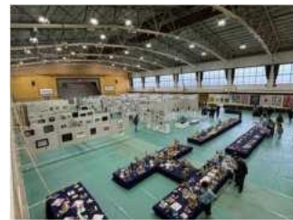
高島市美術展覧会