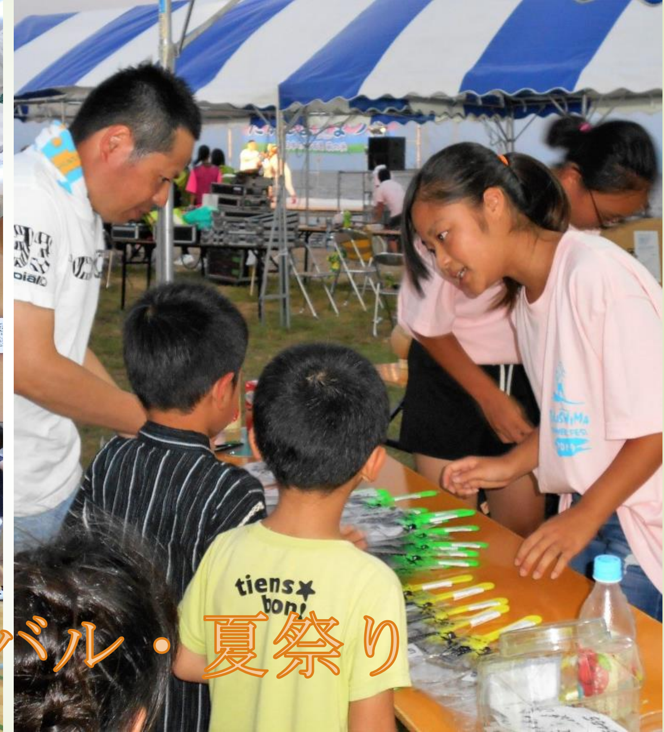
スポーツカーニバル・夏祭り