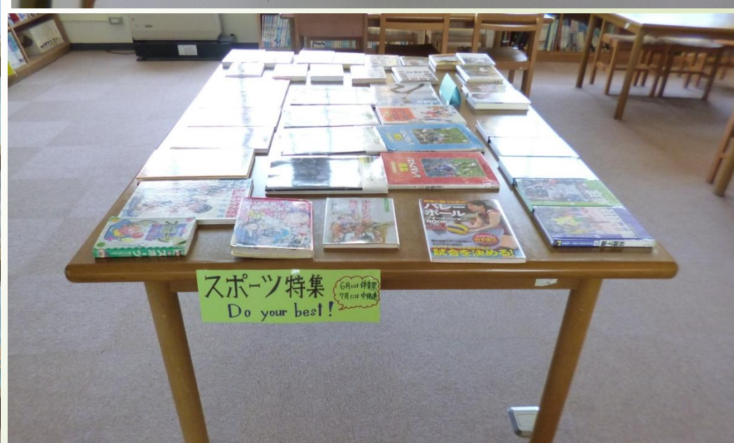
図書室のリニューアル