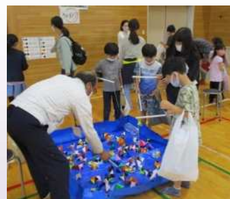
地域住民との秋まつり