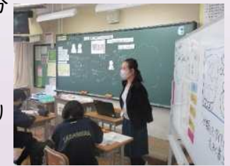
発信力を高める授業

児童生徒が深く考え、議論する授業を展開し、自他を認め合い、よりよく生きていこうとする心情を養います。