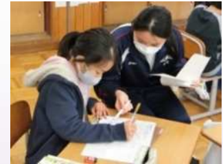
ビルドアップタイム