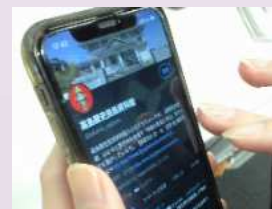
資料館のツイッター発信