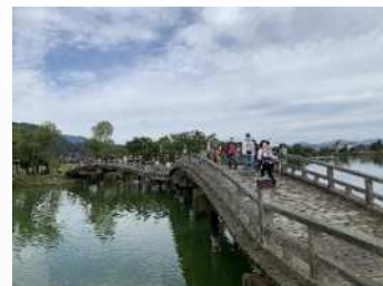
里湖ウォーキング