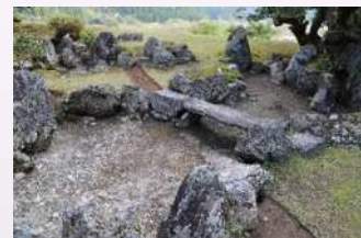
旧秀隣寺庭園の整備