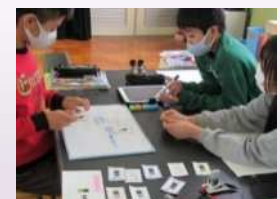
プログラミング教育