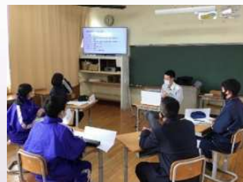
地域で活躍する大人との交流会