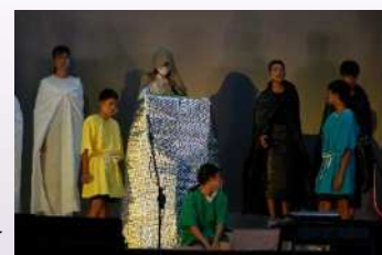
生徒会による人権劇