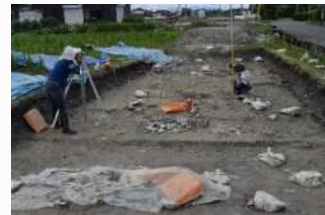
大將軍塚遺跡発掘調査