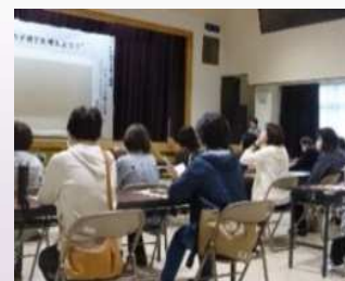
地域教育力向上講座