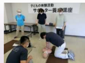
サポーター養成講座