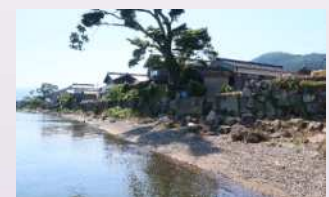
海津の石積み保存修理