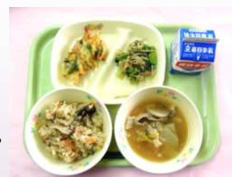
未来へ伝える食「高島デー」