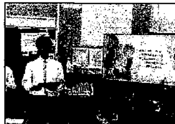
8年生のプレゼンテーション

6年生に、中学生になる心構えを伝えるとともに、中学校生活への不安を解消するために、8年生が6年生の教室を訪問し、「中学校生活」について紹介しました。6年生は、8年生のタブレットを使った工夫を凝らした説明や英語弁論の見事さに憧れを感じるとともに、「体育祭や文化祭、部活動が楽しみ。」「生徒会活動、僕もやってみたい。」等、中学校生活への明るい展望をもつことができました。また、「小学校を卒業するまでに提出物をきちんと出せるようになりたい。」「敬語を使えるように頑張りたい。」等の生活を見直す声もありました。8年生は、これまでの中学校生活を見直す機会となり、9年生が卒業したあと、「学園のリーダーになろう。」という自覚と決意を新たにしました。