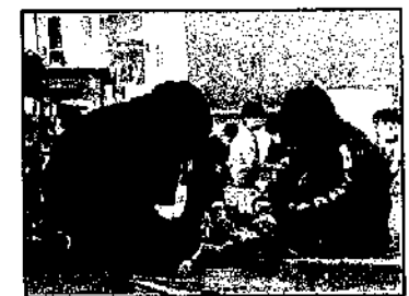
学習ボランティア(図工)

9年生に見守られながら一生懸命駒回しを頑張る1年生。図工科では「ここを持っていてあげるから、ケガしないように釘打ちしようね。」等、心を込めて笑顔で声をかけながら進める9年生。低学年の嬉しそうな姿に、8年前の自分たちの姿を重ね合わせながら、9年間の学園の生活を振り返るとともに、相手を思いやる大切さを学ぶ機会となりました。小学生も学園のお兄さんお姉さんに教えてもらうことで、大変意欲的に活動しました。授業が終了して休み時間になっても、互いに離れがたくふれあっている様子は、とても微笑ましく、学園ならではの活動となりました。