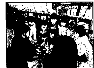
絵本の読み聞かせ