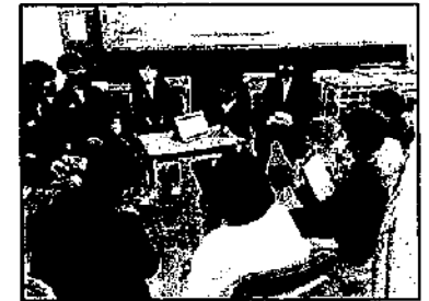
交流会での質疑応答

4年生の「二分の一成人式」は、毎年3学期に実施しています。4年生は「未来をみつめること」、8年生は「今までの学校生活を振り返り、学園の最高学年になるための意識を高めること」をねらいに交流しました。今年度は、4年生からの夢を聞き、このことに対して8年生が答えるという交流する場を設けました。4年生からは、「中学校生活で大切なことは何ですか」という問いかけに対して、8年生からは、「自分を支えてくださっている家族へ感謝する気持ち」や「積極性・粘り強さ・常に前を向くことを大切にすること」と答えていました。4年生はこれからの生活で大切なことを考えるきっかけになり、8年生はこれまでの生活を見つめ直す機会となりました。