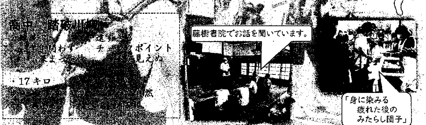
高島中学校 踏破川柳

今回の活動で、保護者や地域のボランティアのみなさんには、グループのメンバーとして一緒に歩いたり、交通立番をしていただいたり、エイドステーションで迎えていただいたり、最後のゴールでみたらし団子を準備していただいたり、さまざまな形で支えていただき、支援していただきました。みなさんからの声援・支援が、どれほど心と体に力を与えてくれたことでしょうか。感謝の言葉しかありません。本当にありがとうございました。