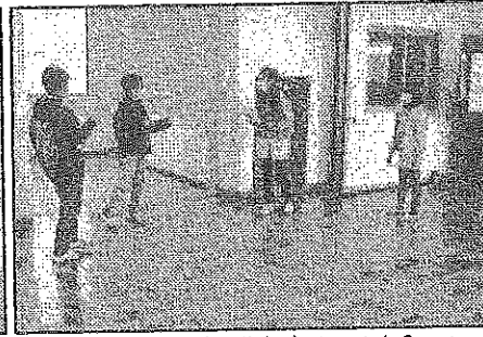
< 5年:「この注意の仕方いいのかな?」 >