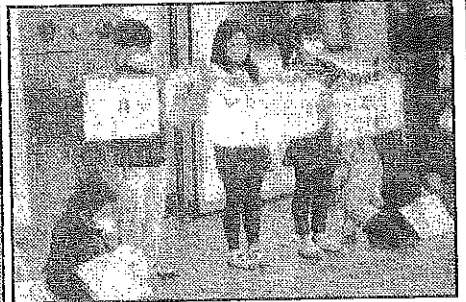
< 3年:「スリッパをならべよう」 >