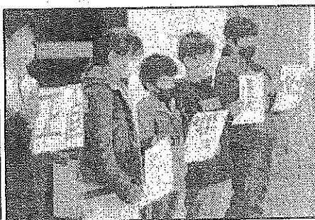
< 4年:道徳で心に残ったことを発表 >