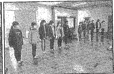
< 6年:自分の良さを再認識し、発表しました >

12月8日(水)に、『人権集会』を行いました。本校では、毎年12月4日～10日が人権週間であることにちなみ、この時期に、各学年で『人権』に関する話を話し合い、学びを深めて、その成果を全校生の前で発表しています。今年度も児童たちは、これまでの自分たちの言動や生活態度などを振り返り、みんなが笑顔で学校生活を送れるようにするためには、どうすれば良いかを発表しました。どの学年もよく考えられており、発表の仕方も工夫されていて、発表の態度も真剣そのものでした。