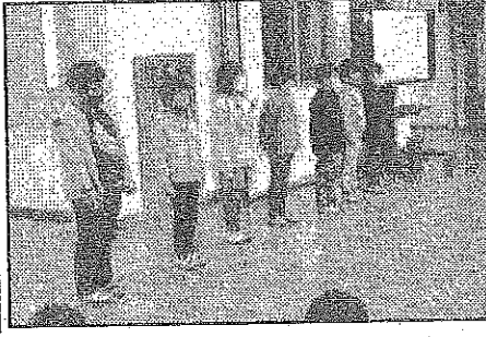
< 2年:「しあわせがいっぱいになるといいな」 >