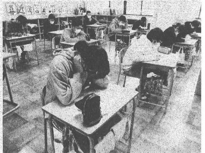
< 1月27日 6年生 朝学習の様子 >

現在、本校では、水曜日以外の朝8時15分～30分の時間を利用して朝学習をしています。この時間は、もともと朝読書などの時間として設定していたのですが、臨時休業で授業時数が少なくなったため、少しでも授業時数を確保するために、学習時間に変更したものです。15分という短い時間ですが、漢字や計算など基礎的な内容を学習する時間として活用しています。(このように、通常45分の授業を15分ごとの3つに分ける短時間学習のことをモジュール学習といいます。3回のモジュール学習で1回分の授業とカウントします。)当初は、そのような短い時間で学習効果上がるのか疑問視していましたが、先日、全職員で検証したところ、短時間に集中して学習することができ、十分な効果が上がることが分かりました。今後も、学習方法を工夫して、効果を高めていきたいと考えています。