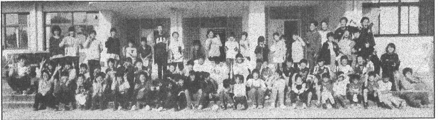
< 11月18日（水）6時間目 『ぐるぐるリレー』終了後に全員で集合写真 みんな笑顔で一杯です >