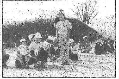
< ぐるぐるぐる 今どっち向き？ > < じゃんけんもソーシャルディスタンス > < 最後に感想を発表しあいました >

今年度は、コロナ禍のため学校行事や学年行事を中止または内容を変更せざるを得なかったり、児童が楽しみにしていたイベントが少なくなりました。日常生活も、うがいに手洗い、マスク着用、3密回避と制約されることが多々あり、また、今年度の2学期は期間がたいへん長いので、子どもたちはストレスを溜めてしまいがちではないかと案じています。