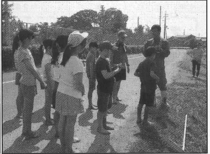
< 初めての泥の感触 気持ちわる～から気持ちいい～へ >