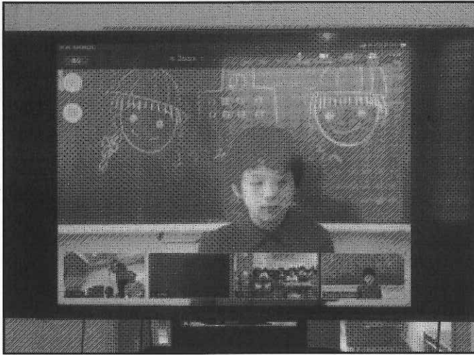
< Zoomの画面 少々緊張気味の6年生 >