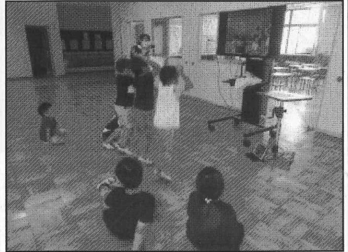
< 画面を通して一体感 1年生も大はしゃぎです >

6月19日（火）、ようやく『1年生歓迎会』を開催することができました。例年であれば4月中に開催し、体育館で全校児童と一緒にゲームを楽しんだり、1年生を紹介したりしていた行事です。今年度は1年生が入学してまもなく臨時休業になってしまい、長い間2～6年生のお兄さんお姉さんと交流したり遊んだりすることができませんでした。また、学校再開後も感染予防のため一緒に活動することができない状況が、今も続いています。