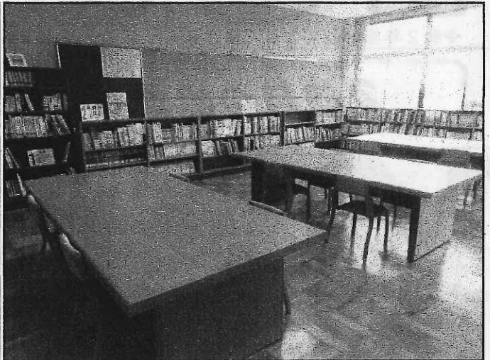
< 第1図書室 日本文学、外国文学、絵本が揃っています >