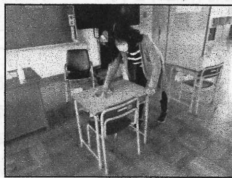
< 児童の下校後、校舎内を消毒 >

いよいよ学校再開です。6月1日は、2回目の始業式です。心機一転して新たなスタートを清々しく切りたいと思います。