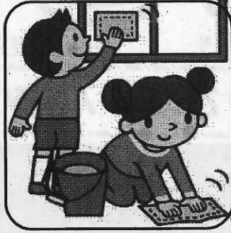
< しっかりお手伝い >