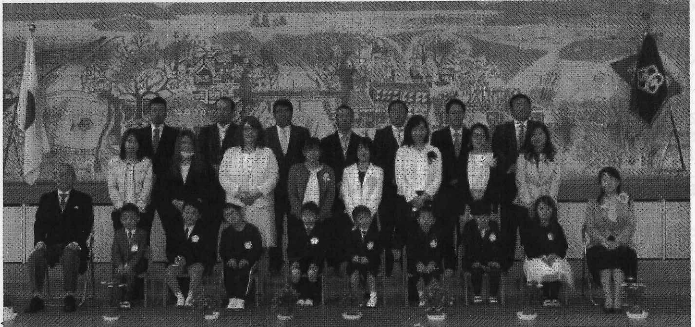
入学式終了後の集合写真 お家の方と一緒に笑顔とちょっぴり緊張の面持ちで >

4月8日。桜の花がこの世の春よと咲き誇る中、『令和2年度 高島市立本庄小学校入学式』を、無事に執り行わせていただきました。新型コロナウイルス感染症の影響で、在校生は参加することができず、来賓の方にも臨席していただけない中での挙行となりましたが、8名の入学生は、元気に明るく入学してくれました。これから6年間、様々な経験を通して、豊かな心とたくましい体を育てていってほしいと思います。