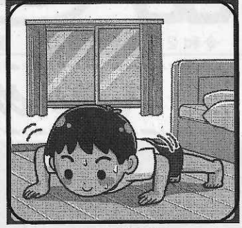
< お家で運動 >

新型コロナウイルス感染症が世界的に流行し、途中で数日の登校できる日はあったものの、実質2ヶ月間の臨時休校となってしまいました。各ご家庭では、お子さんのお家での過ごし方について、さぞかしご苦勞やご心配をいただいていることと思います。中には、友だちのお家に遊びに行ったり、どこかに出かけたりしたくて、うずうずしているお子さんもおられるのではないのでしょうか。しかし、今は日本でも世界でも『じっと我慢』が求められているときです。不要不急の外出はできるだけ避け、大切なお子さんが感染することがないように、くれぐれもご配慮ください。