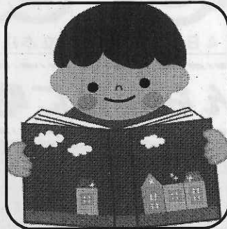
< じっくり読書 >