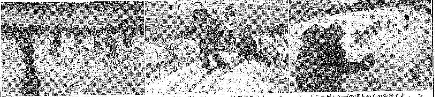
< 「初めは、歩く練習です。」 > < 「転ばずに滑れるかな～でも頑張ろう！」 > < 「ミニゲレンデの頂上からの風景です。」 >

1月21日(金)に、4～6年生の児童を対象に、『スキー体験会』を実施しました。本来なら2月9日(水)に箱館山スキー場で『スキー教室』を行うはずでしたが、新型コロナウイルスのため中止にせざるを得なくなったため、担任たちが「何とかその代わりになるものを行うことができないか」と知恵を絞り、急遽、何とか開催に漕ぎ着けました。幸いにも今冬はたくさんの雪が降ってグラウンドのミニゲレンデにスキーができるくらいの雪が積もり、また、急なお願いであったにもかかわらずマキノ西小学校さんがスキーセットの貸出に快くご協力くださったおかげで、実施することができました。