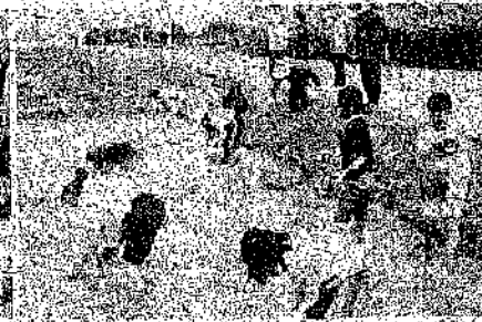
< 5年生 田植え体験学習 >