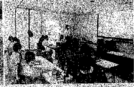
< 6年生 滋賀県平和祈念館見学 >