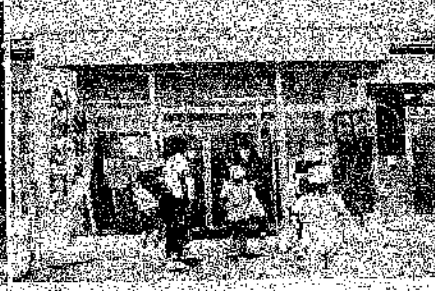
< 2年生 地域探検（JAP-1遊覧） >