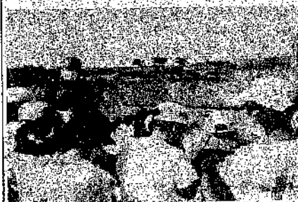
< 3年生 やな漁見学 >