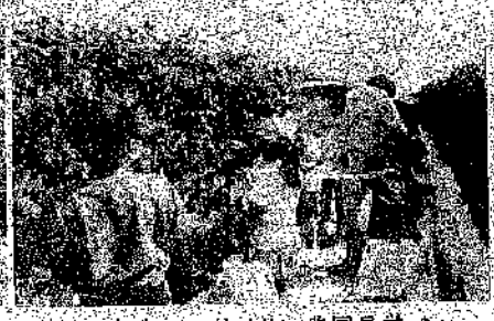
< 3年生 アドベリー農園見学 >