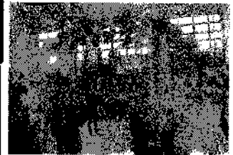
在校生に見送られる6年生

3月3日(火)には、6年生を送る会を行いました。1年生から5年生が学年ごとに6年生との思い出を歌や寸劇、クイズで表現し、感謝の気持ちを伝えました。登下校や縦割り掃除でお世話になったこと、6年生のおかげで「笑い合い、行くのが楽しみ、青柳小」になったことなどを、子どもたちの発想で楽しく表現することができました。堂々と大きな声で発表する在校生に向けて、6年生からは、感謝の気持ちを「ありがとう体操」で表していました。体育館内にいた子どもたちと教職員の心が温かくなり、全員の気持ちが1つになったように感じました。