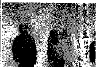
立志の発表をする代表者