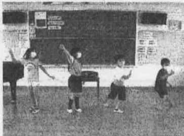
【音楽、ダンスで表現】