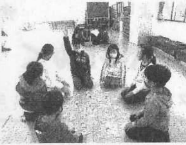
【伝統の藤樹カルタ大会】