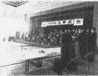
【在校生のいない入学式】