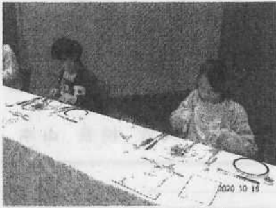
【テーブルマナー講習】