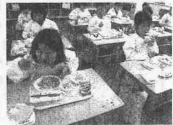
【1年生初めての給食】