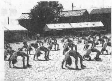
【工夫を重ねた集団演技】