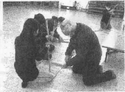
【チャレンジタイム】