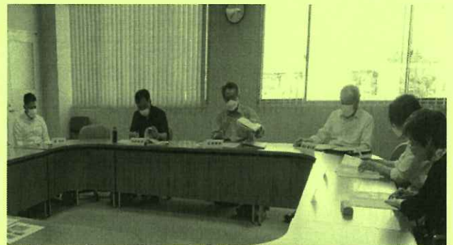
相互支え合い部会の様子

約2年間のコロナ禍が、ようやく終息の方向に向かって参りました。地域の皆様のコロナ前の笑顔や大きな笑い声が戻り、従来の平穏な日々が一日も早く訪れることを願い、元気で活力のあふれる安曇川地域をみなさんと共に作りたいと考えています。