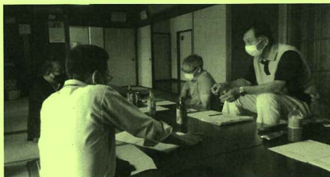
自治会訪問の様子

自治会運営サポート事業では、6月8日より各区・自治会を訪問し、区長さんや区役員さんとのヒアリングを始めました。お話を聞くことにより「地域毎の課題や好事例の共有」を図っていきたいと考えています。