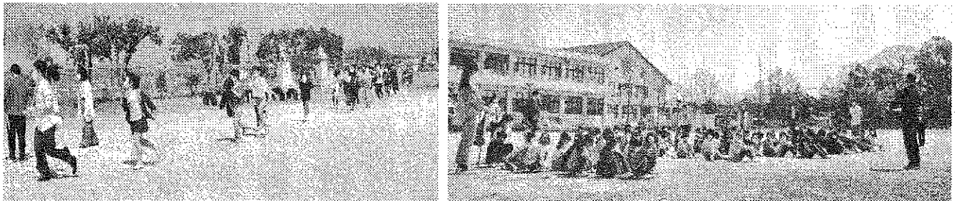
交通安全教室～自転車の安全な乗り方を教わりました(写真は3年生)

避難訓練～災害はいつ襲ってくるかわかりません。本訓練は、新学期から3日目に行い、安全な避難行動について学びました。