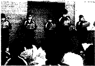
【校友会オリエンテーション】

子どもたちは、感染レベルが下がらない中ですが、自分たちで考え工夫をし、いろいろな活動に取り組んでいます。