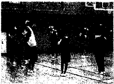
【1年生部活動スタート】

陸上部は、5月3日4日に記録会が行われます。早速、その記録会に出場する1年生もいるようです。