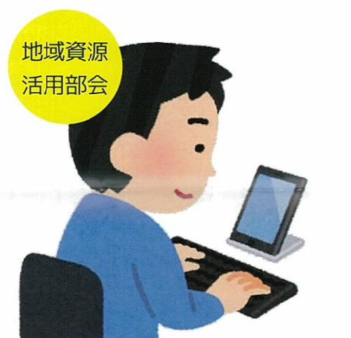
地域資源 活用部会

すみまちの方向性について座談会を開催。まちづくり活動の目的や意義を共有し気運を高める。気楽な雰囲気の中で現状の課題や未来へのアイデアを出し合う。年2回開催予定。