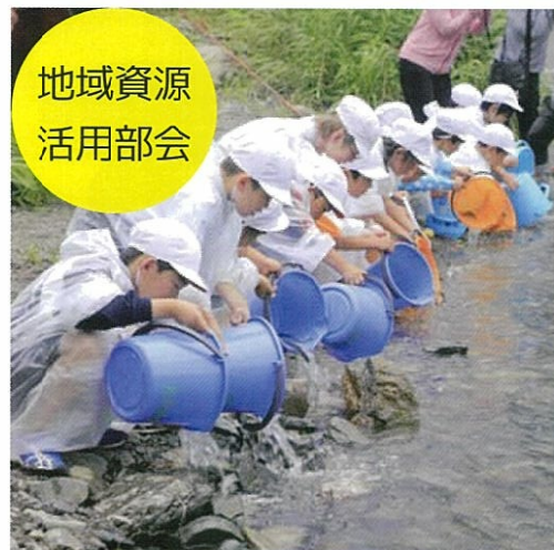
地域資源 活用部会

魅力ある地域づくりを目指して、令和5年度はこんな活動ができればいいな～。(変更になることがあります)