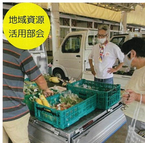
地域資源 活用部会