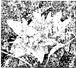
←学校の玄関前で撮影しました