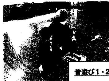
昔遊び1・2年 こままわし・はねつ き・おはじきなどちいきのかたと一 緒に楽しみました。