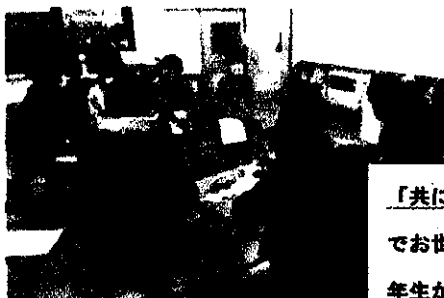
「共に生きる地域の人々」①6年 今ま でお世話になった地域の方と、今度は6 年生が地域にできることについて話し合 いました。6年生、やってみたいことが たくさん見つかりました。