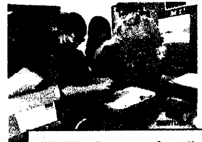
草木染め2年 マリーゴールド とタマネギで染めた世界でただ 一つのハンカチ、きれいです