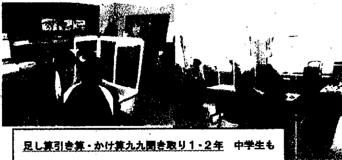
足し算引き算・かけ算九九聞き取り1・2年 中学生も 来てくれ、一週間毎日練習し速く正確に言えるようにな りました。大人も頭の体操になりました。