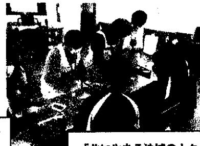
「共に生きる地域の人々」②6年 やってみた いこと【手作り小物の店を出して、朝市を盛り 上げよう】日赤奉仕団の方の協力を得、小物作 りをしました。朝市が楽しみです！