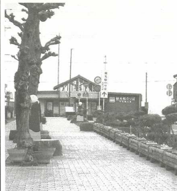
①近江今津駅から今津港までの通り