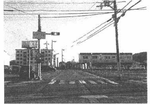
③ 江若鉄道記念通り