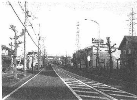
② 駅前ユリノキ通り