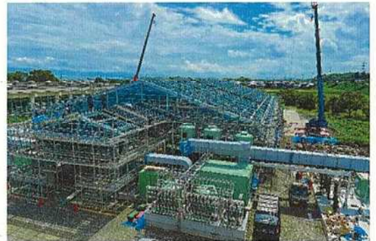
コンポスト化施設 (建設中 R5.10.13 現在)