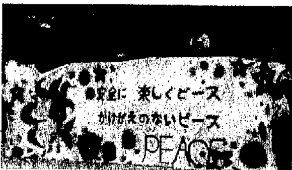
(テーマ：美術部作成)

全校生徒の息が合ったダンスは、表情もよく、練習の時からとても良い雰囲気で行われていました。当日の「ええやん、今中」コールは感動的でした。全校生徒が「ええやん、今中」という気持ちになり、地域の方からもその声が聞こえることを願います。まだまだ皆さんには力があります。その力をプラスに働かせ、地域の一員としての活躍を期待します。今年の体育祭で学んだことを、ぜひ今後の中学校生活で生かしてほしいです。