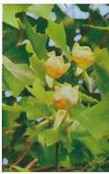
駅前通りに咲くユリノキの花(5月)

さらに愛着をもってより広く知っていただくために、イラスト入りの「看板」を通りに設置することを計画しています。