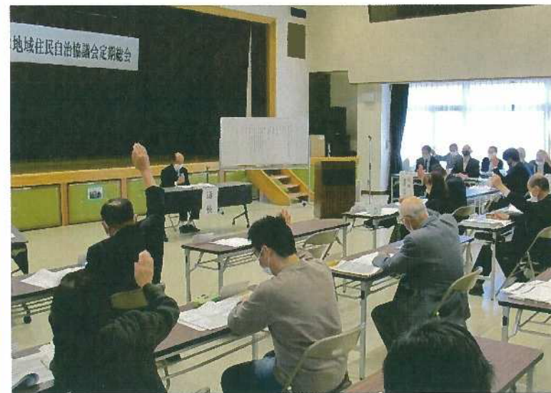
議案審議後、賛成挙手する委員

議案審議後、賛成挙手する委員 分かれ活動をしていきます。令和4年度計画など詳しくは裏面をご覧ください。 また、皆さまからのさまざまなご意見をおまちしています。