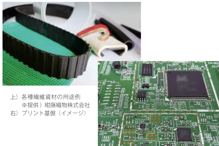
上) 各種繊維資材の用途例 右) プリント基盤（イメージ）