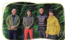
高島の森 - 未来につなぐ 山守を考える会 の皆さん

森づくりの魅力と可能性に気づき、2021 年、タネカラプロジェクト（任意団体）を始動。苗木の地産地消を実現し、地域の生態系に配慮した森づくりに一歩踏み出す。