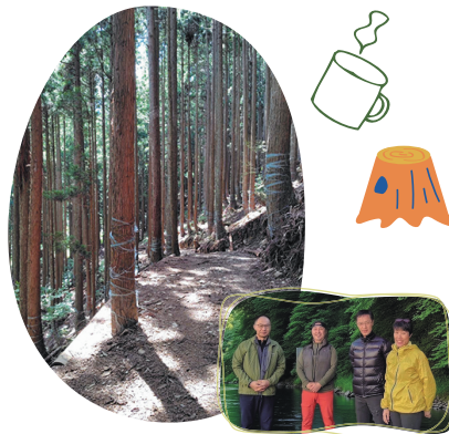
高島の森 - 未来につなぐ 山守を考える会 の皆さん