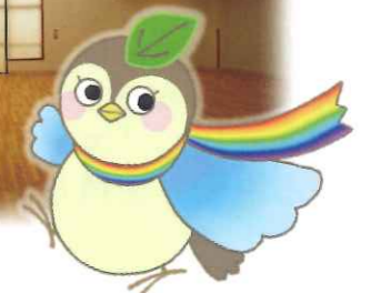
マスコットキャラクター エールちゃん

英語の「エール (yell)」には、「声援」や「励まし」の意味があります。がんばる子どもたちやご家族を、全力で応援するセンターを目指します。また、フランス語の「エール (aile)」には、「翼」という意味があります。子どもたちがそれぞれの色に光輝き、未来に羽ばたく姿をイメージしています。