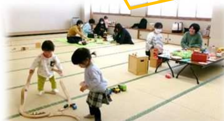
【4/11 安曇川公民館 2階和室】

日時：6月19日(水) 10:00~12:00 場所：今津保健センター 対象：未就園児とその保護者