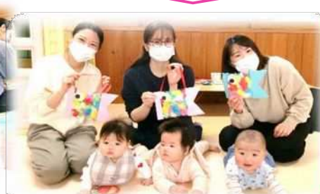
【4/18 いっちゃん・にこちゃん】