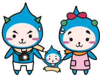
高島市 Instagram キャラクター たかPファミリー

琵琶湖の水、約 1/3 を生み出す水源地。滋賀県高島市から琵琶湖へ流れ出る川からは、琵琶湖の水の約 1/3 を占めています。このことは、近畿約 1,400 万人の水を支えているまちと言っても過言ではありません。高島市民の暮らしを支える仕事は、近畿の人々を支える仕事にもつながっています。