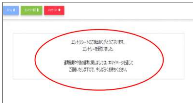
[ 本登録完了表示画面例 ]