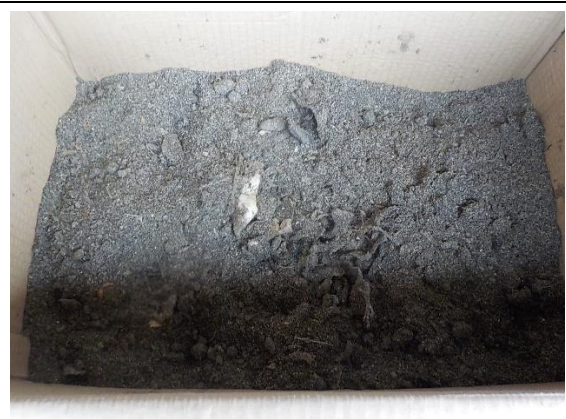
10月19日(月) 午後 19度