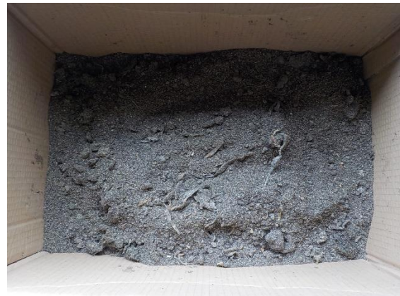
10月20日(火) 午前(米ぬか投入&水分を追加) 23度