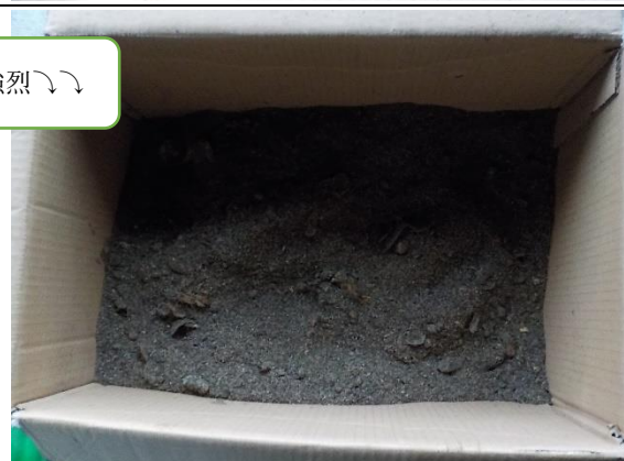
10月12日(月) 午前 (生ごみ&米ぬか投入) 31度