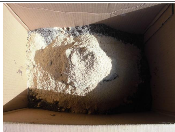
10月12日(月) 午後 44度