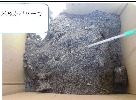
10月13日(火) 午前 39度