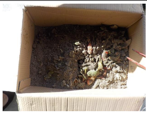
10月27日(火) 午前(生ごみ投入) 40g 52度