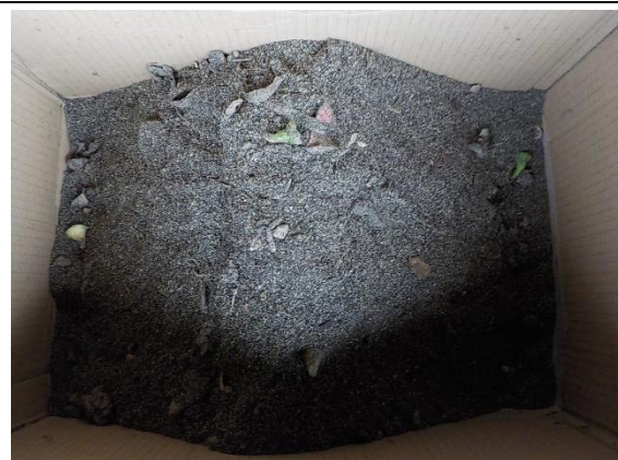
10月9日(金) 午後 (生ごみ投入)