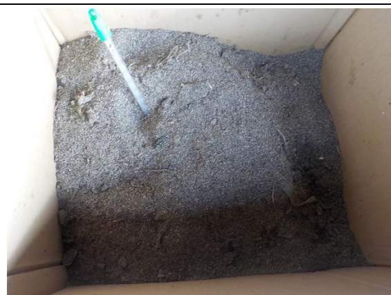
10月13日(火) 午後 50度