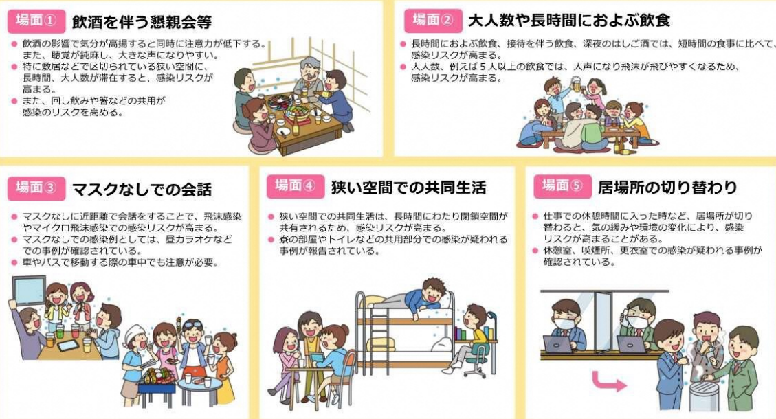
図2 感染リスクが高まる「5つの場面」（内閣官房のウェブサイトより一部抜粋）