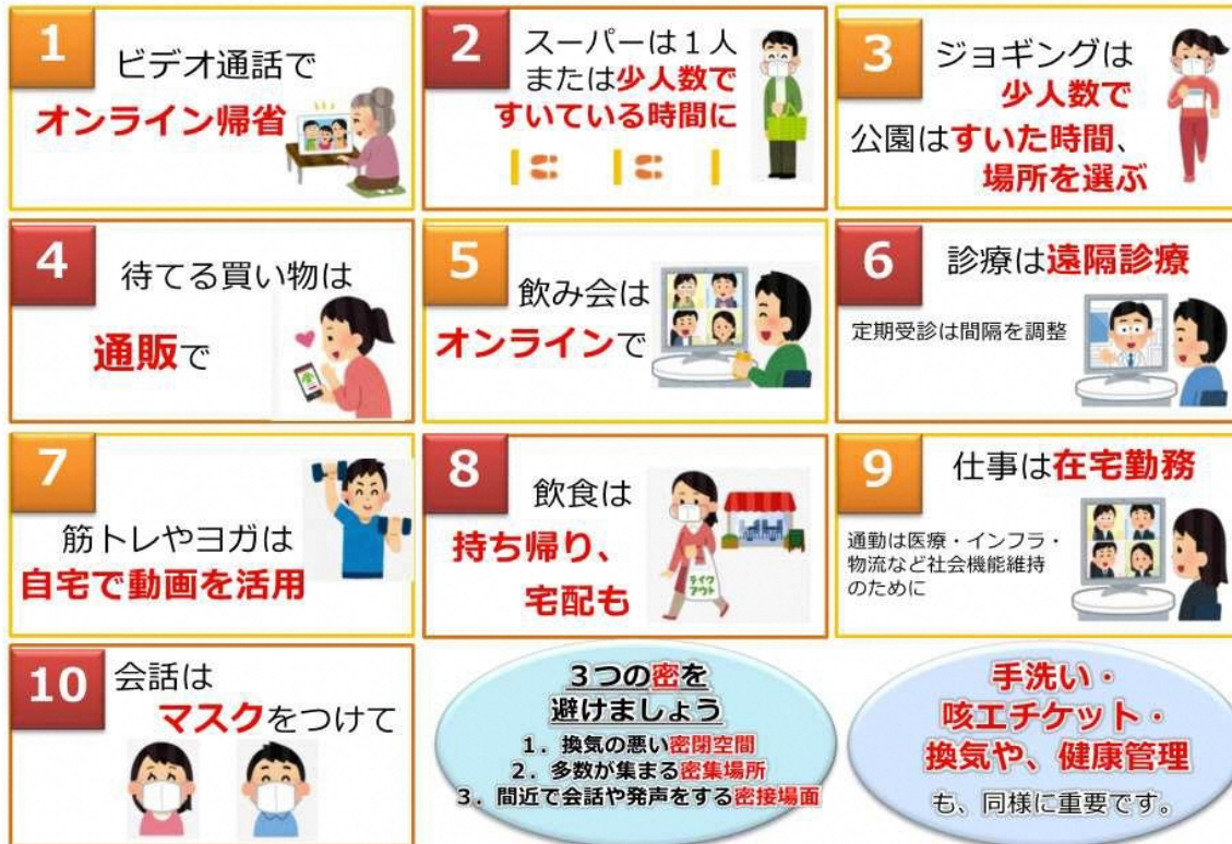
図1 人との接触を8割減らす、10のポイント（厚生労働省のウェブサイトより一部抜粋）

緊急事態宣言の中、誰もが感染するリスク、誰でも感染させるリスクがあります。 新型コロナウイルス感染症から、あなたと身近な人の命を守るよう、日常生活を見直してみましょう。