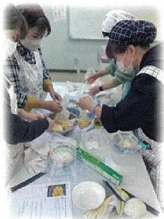
ポリ袋を使った災害非常食作りの様子です。