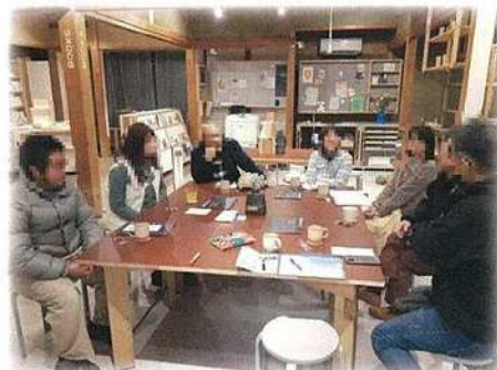
はじめましての方とも気軽に話をしながら新しいつながりを広げています。