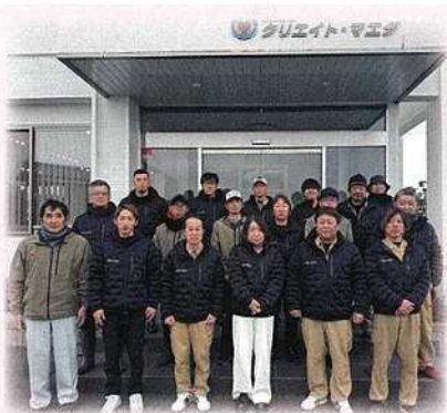
有限会社クリエイト・マエダの皆さん

どんな日でも行うゴミ回収作業に「ありがとう」と言われる時、お庭の草刈りをして感謝されるときにはやりがいを感じるのとこと。地域に密着し、暮らしの基盤を支え、循環型社会を作っておられる現場の声を聞かせていただきました。