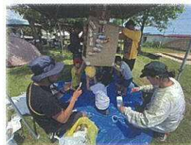
集めたゴミから… アート作品誕生！

では市民の皆さんがより気軽にスポーツに取り組んでいけるようさまざまな取り組みを行っています。認定 NPO 法人 TSC との協働提案事業もそのひとつ。