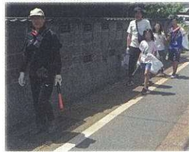
ゴミ拾いをしながら ウォーキングを