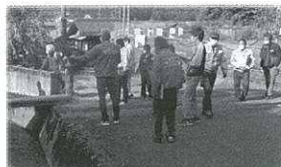
「地域探訪」を行いました

所在地: マキノ町蛭口260-1 (マキノ土に学ぶ里研修センター) TEL: 090-2115-9137 メール: makino.jichi@gmail.com