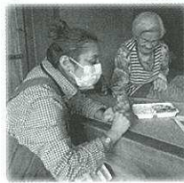
「元気にしてた〜?」「いつもありがとうな」

愛称「すみまち」 所在地: 朽木市場604 (朽木支所) TEL: 0740-29-0007 (市外局番からおかけください) 執務日: 月・金: 9時～16時、火・水・金: 8時半～17時