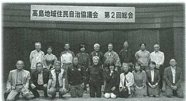
総会では地域の歴史をテーマにした朗読劇を上演し、地域への理解を深めました

愛称「サポートリング∞たかしま」 所在地: 勝野670 (高島公民館 2階) TEL: 090-2115-9055 執務日: 火～日 10時～13時 (月曜休館)