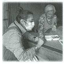
「元気にしてた〜?」「いつもありがとうな」

「安心して笑顔で暮らせる地域づくり」をめざし、人や物の動きと人や物の流れが生み続けられる地域づくりを進める活動をしておられます。 高齢の方へ月1回の見守りを兼ねての「げんき・くつき・すみまち弁当」配達は、受け取る方も届ける方もお互い笑顔になれる活動とのことです。秋に開催予定の「第2回食の見える化事業」では、軽トラ市で朽木の米や家庭菜園のお野菜販売、しめ縄ワークショップなど出店してもお買い物しても楽しい一日になりそうです。自然いっぱい朽木ですが、自然に触れる機会が少ない今の子どもたち。くつきの森で「すみまちキャンプ」も企画されています。 「いろいろな人がそれぞれの得意なことや好きなことで協力してほしい」と参加者を募集されています。無理なく、少しずつ、楽しく、持続可能な地域づくりをめざしておられます。