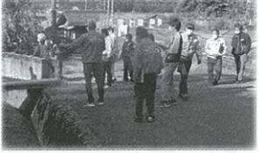
「地域探訪」を行いました