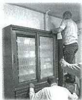
みんなで協力して作業します!

防災部会では広域避難所ごとに区役員が避難所運営について話し合う、打合せ会議の開催を予定しております。また、高齢者宅の家具転倒防止器具の設置も継続されます。