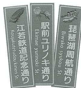
こんな看板ができました!

地域で活躍する団体同士のつながりを作り、連携で活力ある今津地域をめざしておられます。通りのネーミング事業では看板イラストを高島高校美術部に依頼。「琵琶湖周航通り」、「駅前ユリノキ通り」、「江若鉄道記念通り」のイラスト入り看板が設置されました。中学校との連携では、絵とひらがな表示の誰でも理解できる「ゴミ出し案内」を作成。地域の声を形にしております。 2024年から5年間のまちづくり計画を作るために、30〜60代の地域も関心もさまざま17名が取組んでおられます。今津の魅力を活かしたまちづくりを話し合い、その経過を広報誌「つながろう今津」でお知らせされますので、ご意見をお寄せください。