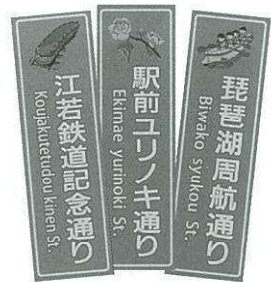
こんな看板ができました！

地域で活躍する団体同士のつながりを作り、連携で活力ある今津地域をめざしておられます。通りのネーミング事業では看板イラストを高島高校美術部に依頼。「琵琶湖周航通り」、「駅前ユリノキ通り」、「江若鉄道記念通り」のイラスト入り看板が設置されました。 中学校との連携では、絵とひらがな表示の誰でも理解できるゴミ出し案内を作成。地域の声を形にしておられます。 2024年から5年間のまちづくり計画を作るために、30〜60代の地域も関心もさまざまな17名が取組んでおられます。今津の魅力を活かしたまちづくりを話し合い、その経過を広報誌「つなごろう今津」でお知らせされますので、ご意見をお寄せください。